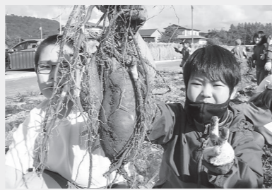
見事に育ったサツマイモをGET!