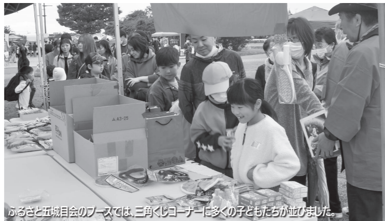
ふるさと五城目会のブースでは、三角くしコーナーに多くの子どもたちが並びました。

ステージイベント終了後には、復興への祈りを乗せた打ち上げ花火が町の夜空を彩りました。