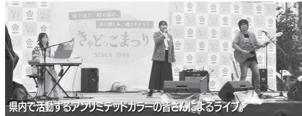
県内で活動するアンリミテッドカラーの皆さんによるライブ。