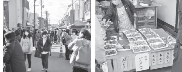
朝市通りには、きのこや栗といった秋の味覚が並び、多くの方が来場しました。

10月22日、秋の朝市「きのかまつり」を開催しました。朝市通りでは、なめこやしいたげなど旬のきのこが並んだほか、だまこ鍋やだまこそば、味噌たんぼなどが振舞われました。当日は、朝市plus+の開催とも重なり、会場は多くの出店者と来場者でにぎわいました。