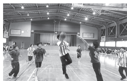
バスケットボール