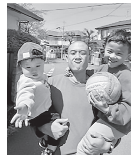
息子さんと一緒に。

私は、中学校卒業時までは、五城目町内川にある家で暮らしていたのですが、高校生の時には校舎近くの下宿に住まわ