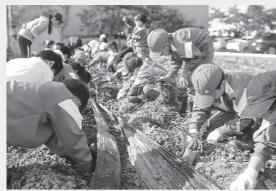
3年生によるサツマイモ収穫の様子

収穫されたサツマイモは、11月10日(金)午前9時30分から10時30分の朝市開催日に、3・4年生による「朝市販売体験」で販売されますのでぜひご来場ください。