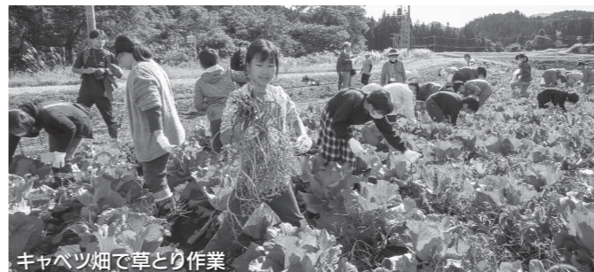
キャベツ畑で草とり作業