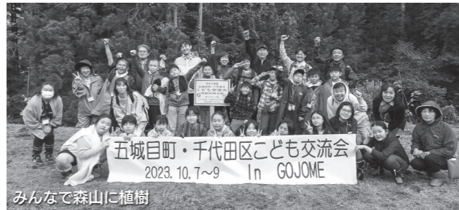
みんなで森山に植樹

10月7日から9日の3日間、千代田区と町の子どもたちに交流を深めてもらうことを目的とした「千代田区・五城目町児童双方向交流事業」を行いました。「コロナ禍の影響のため4年ぶりの開催となった本事業。当日は、千代田区・本町ともに10人の児童が参加し、農林業体験や、郷土料理である「だまこ鍋」づくり体験などを楽しみました。本事業は、来年の2月に千代田区を開催地として実施予定です。