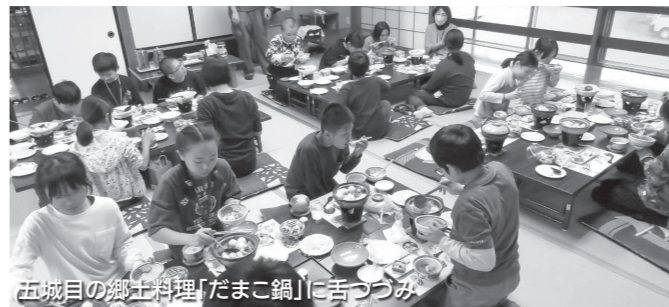
五城目の郷土料理「だまこ鍋」に舌つつみ