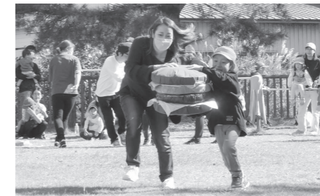
3年ぶりに屋外での開催となった同大川分園の運動会。園児たちは、かけっこや親子競技に全力で取り組みました。