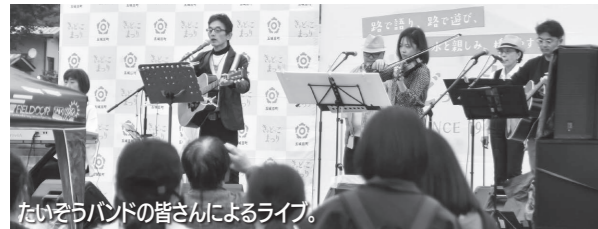
たいそうバンドの皆さんによるライブ。