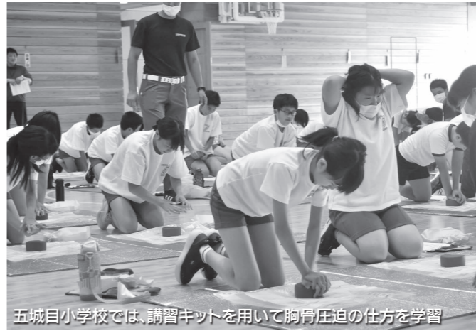
五城目小学校では、講習キットを用いて胸骨圧迫の仕方を学習

9月8日に五城目小で、10月4日に五城目一中でそれぞれ応急手当講習を行いました。当日は町消防本部の職員が講師となり、目の前で救命措置が必要な人が現れた場合の、心肺蘇生のための胸骨圧迫の仕方やAED(自動体外式除細動器)※の使用方法を指導しました。