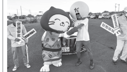
9月29日、五城目警察署管内国道7号沿線4市町による交通安全リレー式キャンペーンを実施しました。