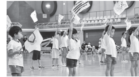
おゆうぎや玉入れ競争で練習の成果を発揮する、もりやまこども園本園の園児たち。

また、10月14日には、同大川分園の園庭で運動会が行われました。屋外での開催は3年ぶりで、園児たちは晴天の下、リレーや親子競技に全力で取り組みました。