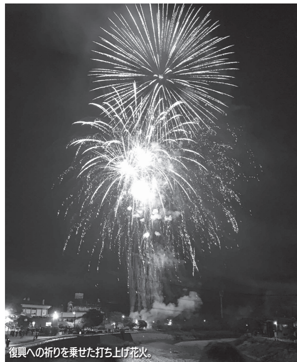
復興への祈りを乗せた打ち上げ花火。