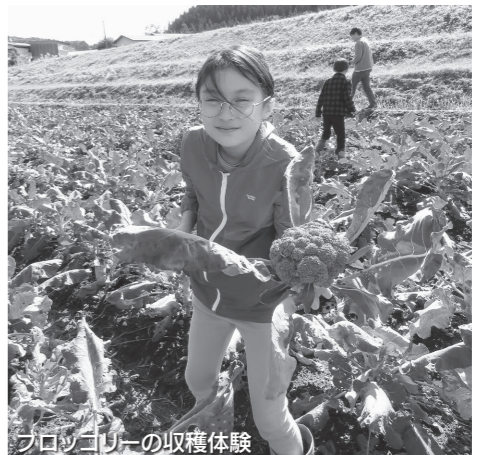
パロココリーの収穫体験