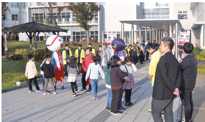
11月1日から2日の2日間、五城目小学校正門前であいさつ運動が実施されました。