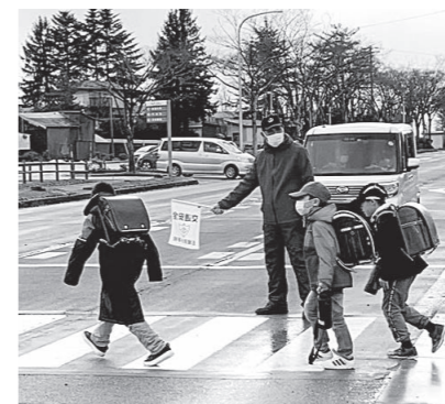
学校支援ボランティアによる下校見守り活動の様子。