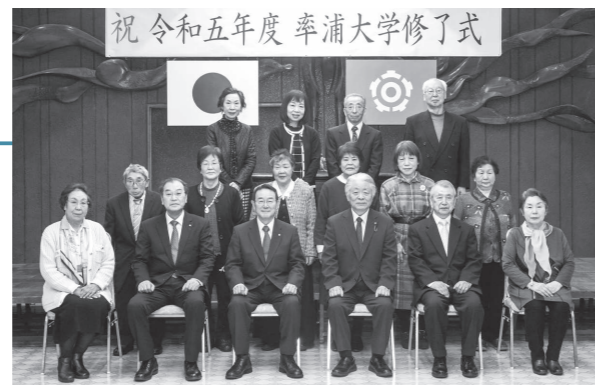
3月12日に行われた「令和5年度率浦大学修了式」の様子。当日は13名の修了生が参加し、代表して□□□□さん(前座右から2番目)があいさつを述べました。