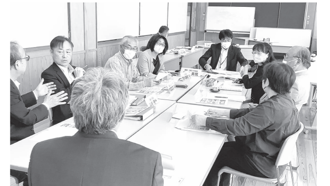
昨年5月24日に実施された第1回協議会の様子。

町では「学校運営協議会」を設置し、学校と家庭、地域が力を合わせて学校の運営に取り組んでいます。令和5年度は、昨年5月から今年2月にかけて計3回の協議会を実施。コミュニティ・スクールに指定されている「五城目小学校」「五城目第一中学校」の関係者や地域住民など、20人の委員が学校運営に関する課題や方針について協議しました。