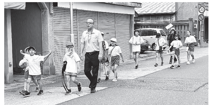
昨年7月10日に行われた「全町ウォークラリー」で町の魅力を発見。