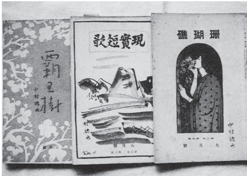
短歌を發表した歌誌