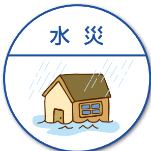
洪水や床上浸水など