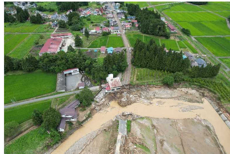
▲令和4年8月の大雨による被災状況