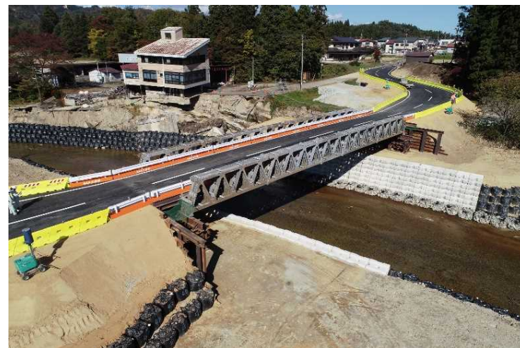
▲応急組立橋設置状況