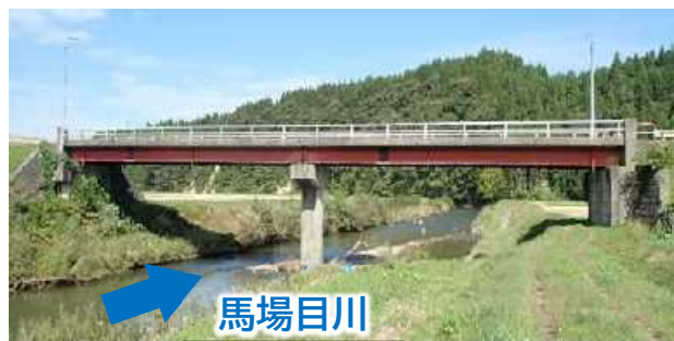
被災前の廣徳寺橋の状況