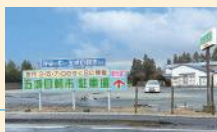
朝市大駐車場 約100台