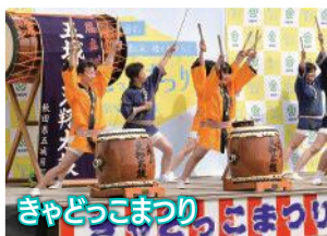
きゃどっこまつり

神輿奉納、太鼓演奏、高性寺で行われる相撲大会など、伝統的な催しが多数開催されます。