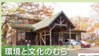
環境と文化のむら

約52haの広大な里山と点在する池周辺に数多くの散策コースが設けられています。☎018・852・2202