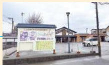
ふれあい館前駐車場 約20台