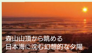
森山山頂から眺める日本海に沈む幻想的な夕陽