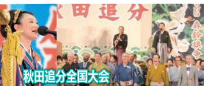
秋田追分全国大会

きゃどっこまつりは、ステージイベントや飲食・体験コーナーが多く開催されます。そして大輪の花火で締め括られます。