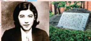
矢田津世子文学記念室(五城館内) 矢田津世子文学記念碑(福祿寿酒造様そば)