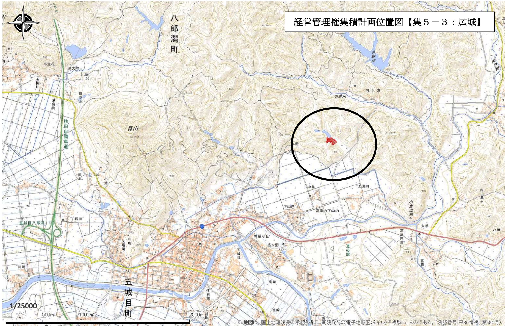
経営管理権集積計画位置図【集5-3:広域】