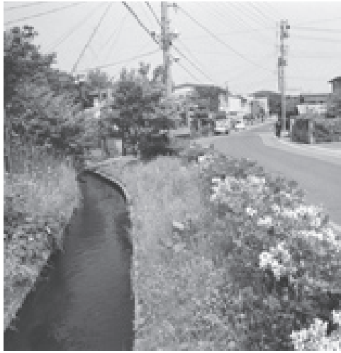
現在の戸村堰（新畑町付近）

寛政五（一七九三）年の「御関根元之書附写」によると、堰工事の時代の村は普通三〇戸から一〇戸ほどで、一戸当りの作付が百刈から七〇刈ほどであったとしている。これの真偽は別として、驚くべき零細である。享保一五（一七三〇）年の『秋田六郡邑記』には、村むらの戸数が記録されているが、次のようになっている。