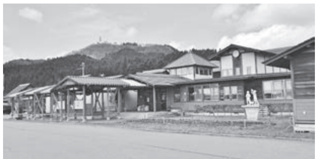
柔軟な対応が求められるもりやまこども園

町長 今年度課長補佐級である参事以上の職員は41名中女性が12名であり、うち3名を管理職として登用している。今後も男女の別なく役職への登用を行っていく。