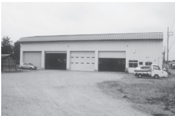
改修される建設課車庫