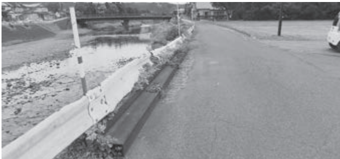
ガードレールが低い 危ない (馬城橋付近)

町長 小学校の移転改築に伴い、児童の居住分布を予測し、通学路やスクールバス・スクールタクシーの運行区域、路線の見直しが必要となるが、現在、変更作業を行っており、今年度中に学校や関係機関と協議し、新しい通学路を設定したい。又、新たに設定した通学路を関係者と実際に歩いて危険個所の把握に努め、新校舎完成までに段階的に整備する。