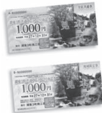
平成27年以来の商品券

額面5千円分を2割引きの4千円で購入でき、上限は①5セット・②5セット×対象の子供の数で、湖東3町商工会に事務委託する予定。有効活用が望まれる。