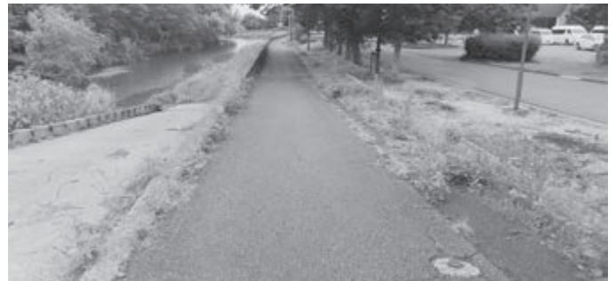
川の増水時は 危ない (広ヶ野橋付近)