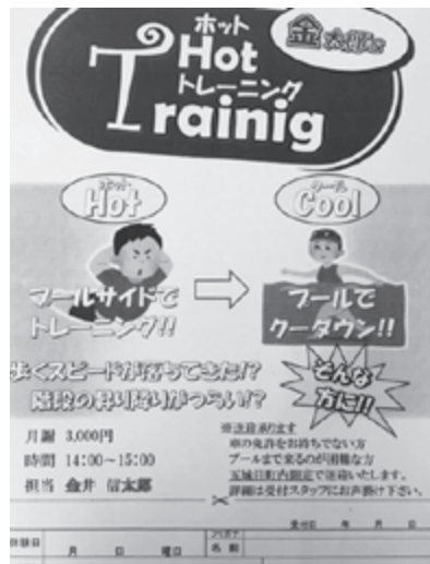
介護予防には水中運動が有効

の意味あいを持った教室を年齢制限を設けず開講し、運転免許を持たないなどプールへ来るのが困難な方には、五城目町内限定で3ヶ月毎に地区を変えて送迎するとの説明があった。各地区の新規利用者の掘り起こしを目指す。