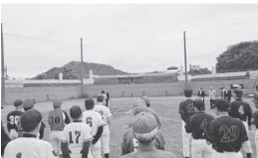
整備が待たれるセンターグラウンド

雀館運動公園整備計画は、公園敷地と小学校改築事業との一体的な計画の策定が必要で、今後新たな計画策定の過程において関係者の意見を伺いながら検討していく。