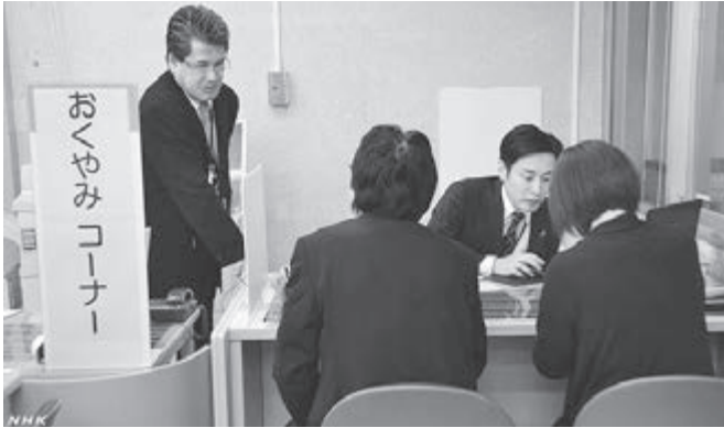
おくやみコーナー設置で住民サービスを

町長 身近な人が亡くなられた後の手続きは、故人によって必要な手続きが異なり、ご遺族に大きな負担となる場合もある。必要な各種手続きや書類をまとめた「お知らせ」を配布し、各担当窓口で専門性を有した職員が対応している。慎重かつ丁寧にご遺族に出来る限り少ない負担で行っているが、今後他市町村の取り組みなどを参考に更なる充実に向け検討していく。