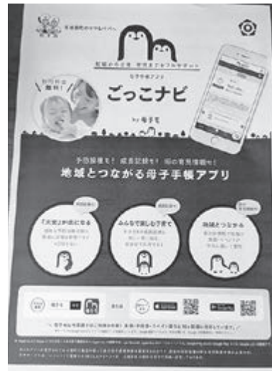
内容の充実が課題

今年度母子手帳アプリ・母子モ（こっこナビ）の利用を開始するなど少子化・子育て対策を積極的に推進している。現在の体制で今後も子育て支援を推進したい。