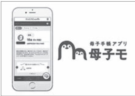
アプリの導入で子育てを支援

「ごっこナビ」を通じて地域とつながり、妊娠から出産、育児まで安心して子育てできる支援体制にしていこう。