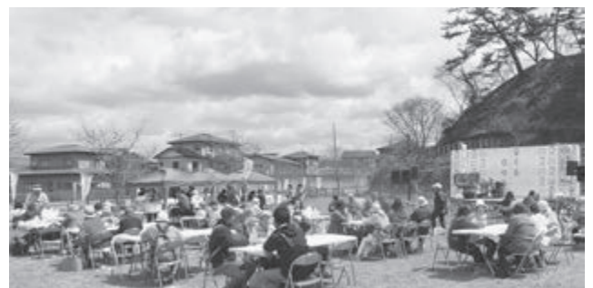
7年ぶりに復活したさくらまつり