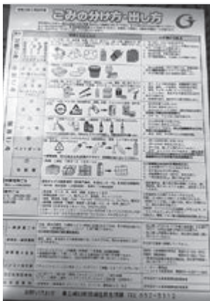
一人ひとりの意識が大切

今回の改訂は、以前より行っていた「水銀含有ごみ」の回収と「一時多量ごみ」の搬入方法が周知不足であったとし、表に追加したもの。