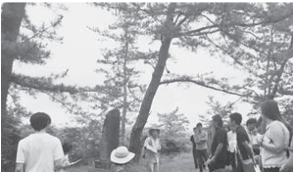
雀館周辺を歩いた昨年のワークショップ

今後、国から工事の確認済証が発行され、補助金の内示を経て、入札、契約発注の流れとなる。