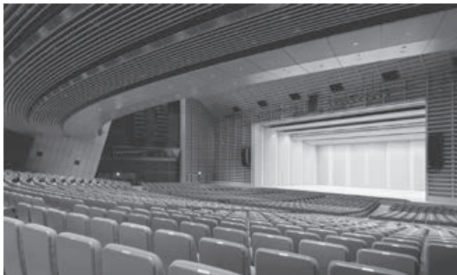
東京国際フォーラムA大ホール