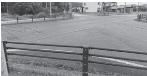
危険な交差点にはガードレールが必要