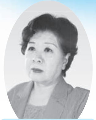
畑澤 洋子 (公明党)

畑澤 死亡届け提出後の手続きは、複雑で面倒であるとの意見が社会的に多い。個人に必要な手続きが、一目でわかる一覧表の作成システム構築・おくやみ早わかりガイドの作成・おくやみコーナーの設置で住民サービスの向上を。