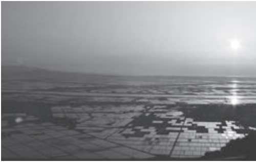
森山から望む絶景は、貴重な観光資源である

荒川 有名旅行雑誌の関東東北版に森山からの眺めの素晴らしさが掲載された。町民としては非常に嬉しいことである。森山を観光の目玉ととらえ、登山道所有民間企業との協議を進め整備するべき。