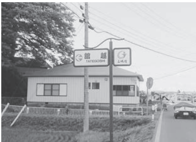
備品が充実する館越町内会