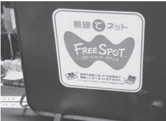
充実してきたWi-Fi環境

観光施設への滞在時間が増えることは、経済効果に波及し、インバウンド（訪日客）対策にもな