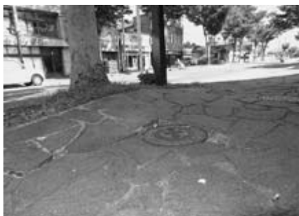
あぶない歩道のデコボコ

町長 町のメインストリートであるので、隆起した根を掘削・除根し補修する。鉄平石を剥離してアスファルト舗装に変更したい。