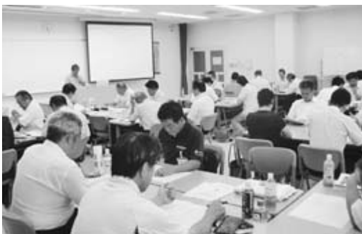
最終日の発表の様子

最終日、8班の発表と質疑であった。私の班は6名であり、「これからの低所得者施策のあり方」について討議し、意見をまとめ、発表した。