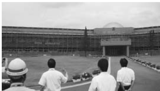
工事中の五一中校舎を視察

* 間口除雪について、早めのPRが必要でないか。間口のみならず、利用しやすい方法も検討すべきである。