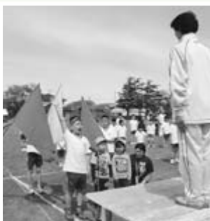
元気な子どもたち

*子ども・子育て関連3法 とは、急速な少子化の進行や都市部を中心とした待機児童問題や放課後児童クラブの不足、子ども・子育て支援が質・量ともに不足している現状など様々な課題を解決するための法律。