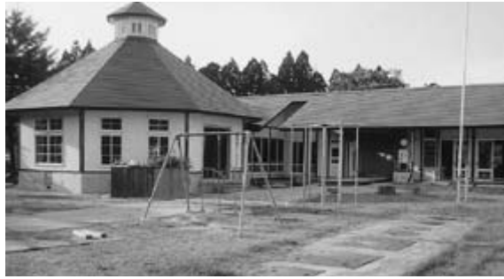
改修工事中の旧馬場目保育園

募集を継続しながら、支援センターを活用した起業セミナーや講習会、施設のPRイベント、地域住民も参加できる音楽会や体育祭など通年イベントの開催を予定している。