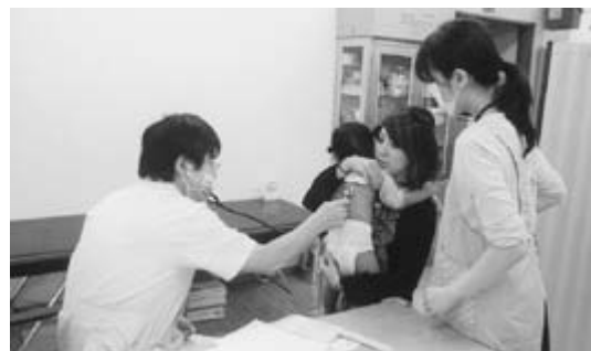
児童検診の充実を期す

畑澤 先天的に脳の一部がうまく働かない発達障害には、自閉症・アスペルガー症候群・注意欠陥多動性障害（ADHD）・学習障害（LD）などがある。LDの中にはトムクルーズ、エジソン、アインシュタインなど、世界的に著名な方々がいる。知的障害を伴わず、外見ではわかりにくい。話す・読む・書く・計算する・推論する能力など特定のものを習得することが困難な状態にある。 5歳児で見極め、早期に支援することが大事だ。これまでの対応と課題は、教職員の理解を深める教育は。 町長 早期発見には2歳6ヵ月以降の検診が重要。検診で発達障害を疑われる小児は、医師が専門機関へ紹介し、町は無料券を発行。今後も最新