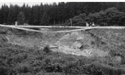
大きな被害の外環状線