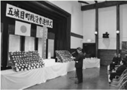
平和への誓いを新たに