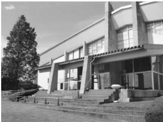
老朽化し更新の時期が近づいている公共建築物