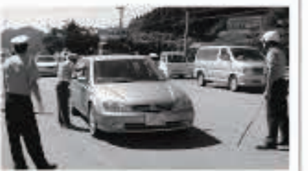
町内会、家族、職場、仲間同士で呼びかけあい、飲酒運転を根絶しましょう。

また7月は「シートベルト・チャイルドシート」着用推進強調月間です。同乗者全員のシートベルト着用及びチャイルドシート使用を徹底して、大切な「命」を守りましょう。