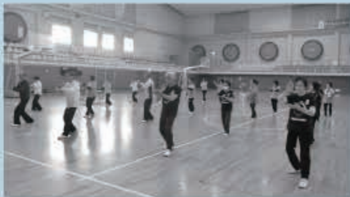
精神を集中させながら、ゆっくりと動く太極拳