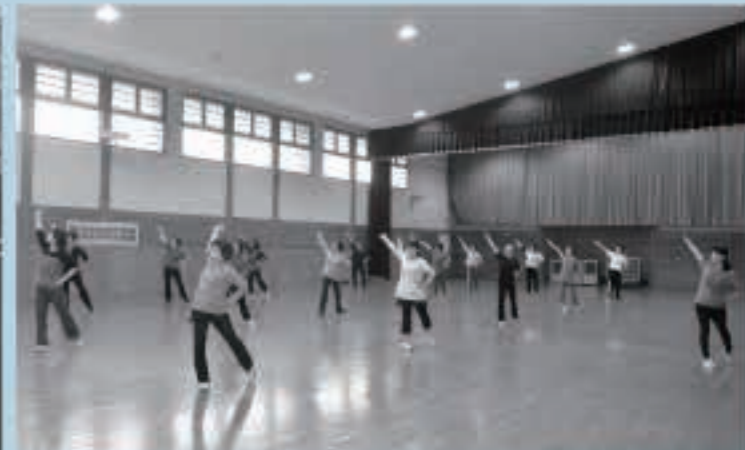
音楽に合わせて軽快に体を動かすリズム体操