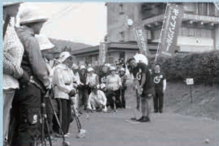
グラウンドゴルフの始球式を行った、チャレンジデー大使の湊祐介さん(ノルディック複合元日本代表)