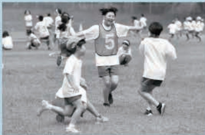
五城目小はみんなでおいごっこ