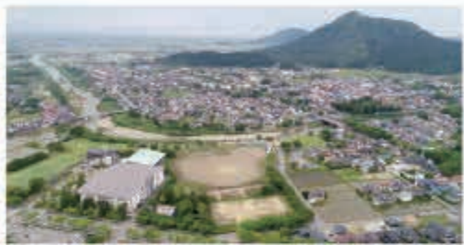
雀館公園上空から見た、新校舎建設予定地