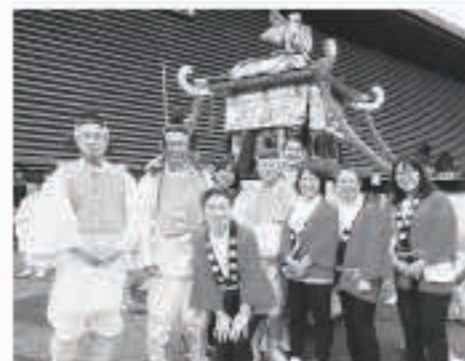
ふるさと五城目会が担いだおみこしの前で記念撮影

ふるさと五城目会もこの行列の一員として、神幸祭に参加させていただきますました。このお祭りには、神輿の屋根に鳳凰の飾りをつけた輿である、鳳輿が2基出ます。男性メンバーはその鳳輿を黄色い衣装を着て引く役目を担わせていただくことになったのです。沿道の幼稚園や保育園の園児、お年寄り、外国人旅行者まで多くの方に始終声をかけられ、写真を撮られました。インターネットで2018年の「日枝神社 神幸祭」と検索をしていただ