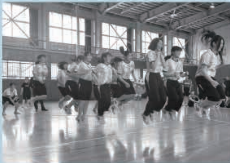
クラス対抗の真剣勝負! 県立五城目高等学校のロープジャンプ

みんなで笑顔で運動することで気持ちが明るくなり、健康につながるのではないのでしょうか。