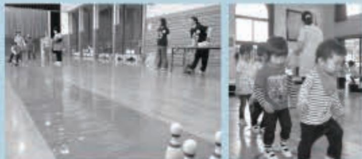
協力しながらピンを倒すスマイルボーリング