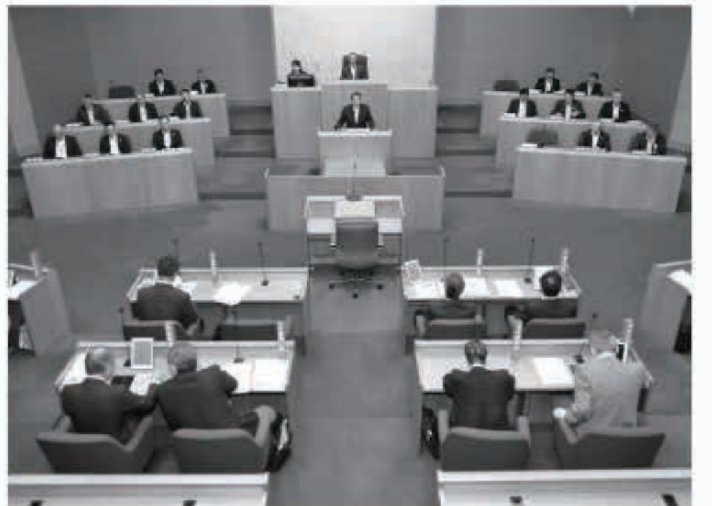
5日間の日程で、10件の案件などを審議し、原案通り可決した6月議会定例会

南秋地域公共交通活性化協議会では、「大瀧村と八郎瀧町」五城目町間を結ぶ地域間幹線交通の導入「誰でも利用しやすい地域内公共交通に見直し、利便性向上」を目指し、大瀧村マイタウンバスと路線バス八郎瀧線の統合・集約や本町と八郎瀧町のデマンド型乗合タクシーの事業再編について、運行形態・運行ルート・運賃設定など、具体的な運行計画を検討するため、コンサ