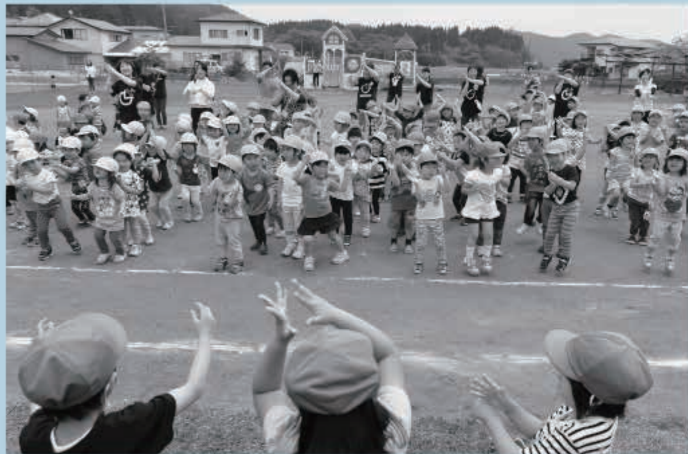
もりやまこども園の「エビカニックス体操」。みんなでエビさんとカニさんのポーズをとりながら、元気いっぱいに踊りました

5月30日、チャレンジデー2018が開催されました。五城目町では、子どもからお年寄りまで8,180人が参加し、参加率は本町過去最高の85.9%を記録。対戦相手の北海道新得町にも勝利しました。