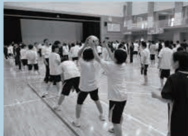
五城目一中は全校でボールリレー

チャレンジデーは、日常的なスポーツの習慣化に向けたきつかけづくりとして、毎年5月の最終水曜日を実施され、人口規模がほぼ同じ自治体間で、15分以上継続して運動した住民の割合を競い合います。 11度目の参加となった本町は、参加率が過去最高の85.9%を記録し、参加率61%以上の自治体に贈られる金メダルを4年連続で獲得しました。 また、5千人以上1万人未満の人口規模で参加率が最も高かった自治体に贈られる、優秀賞を初めて獲得しました。