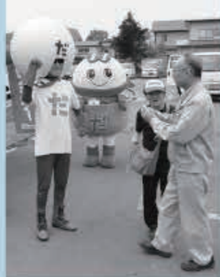
「買い物ウオーキング」には、だまこマンとだまこちゃんが駆け付けました