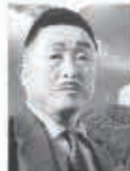
秋田追分創始者 鳥井森鈴翁

秋田追分全国大会は、秋田追分の生みの親である故鳥井森鈴氏の正調秋田追分の正しい伝承と保存、そして普及を目的としています。入場は無料です。ぜひご来場ください。