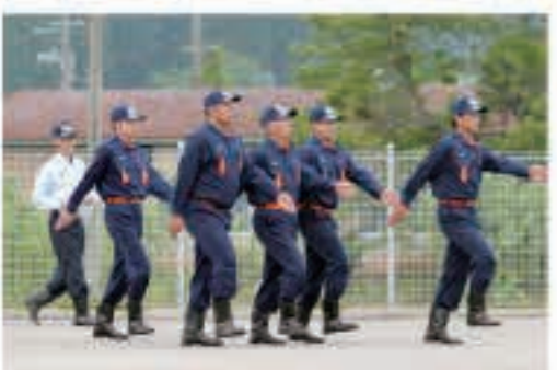
規律訓練(通常点検並びに小隊訓練)の部で優勝した第10分団