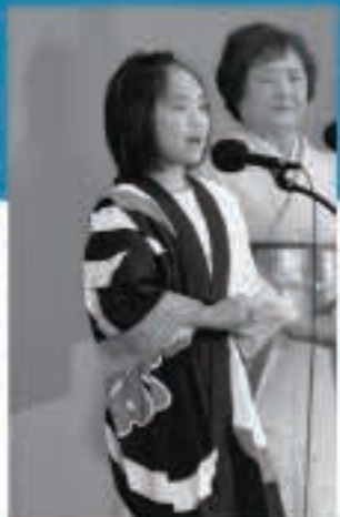
年少の部に出場した □□□□さん(中川原)