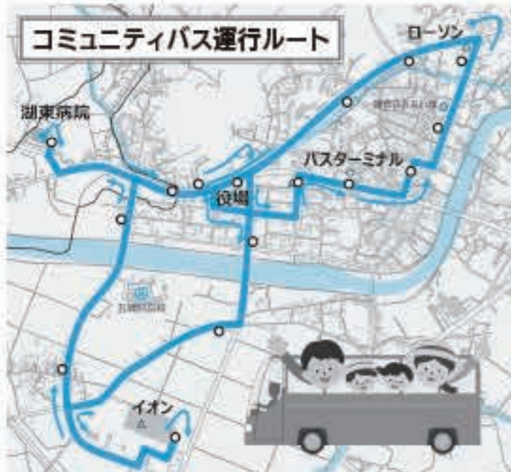
○印は、バス停の場所です。