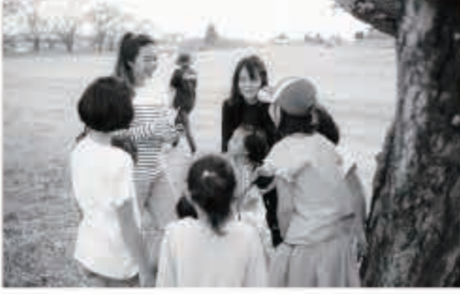
シンガポール人の友人たちに、五城目町の魅力を伝えました

生徒からは、「毎日インターネットを使っている。正しい使い方を身に付け、他人の人権もしっかりと考えるようにしていきたい」などの感想がありました。