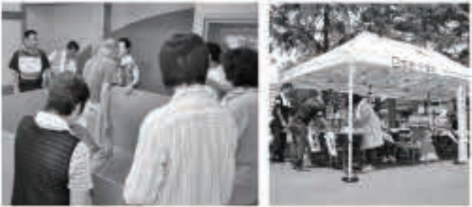
投光器や発電機の取扱訓練㊤や、避難所開設訓練㊦、災害ボランティアセンター開設訓練㊧などを行いました。