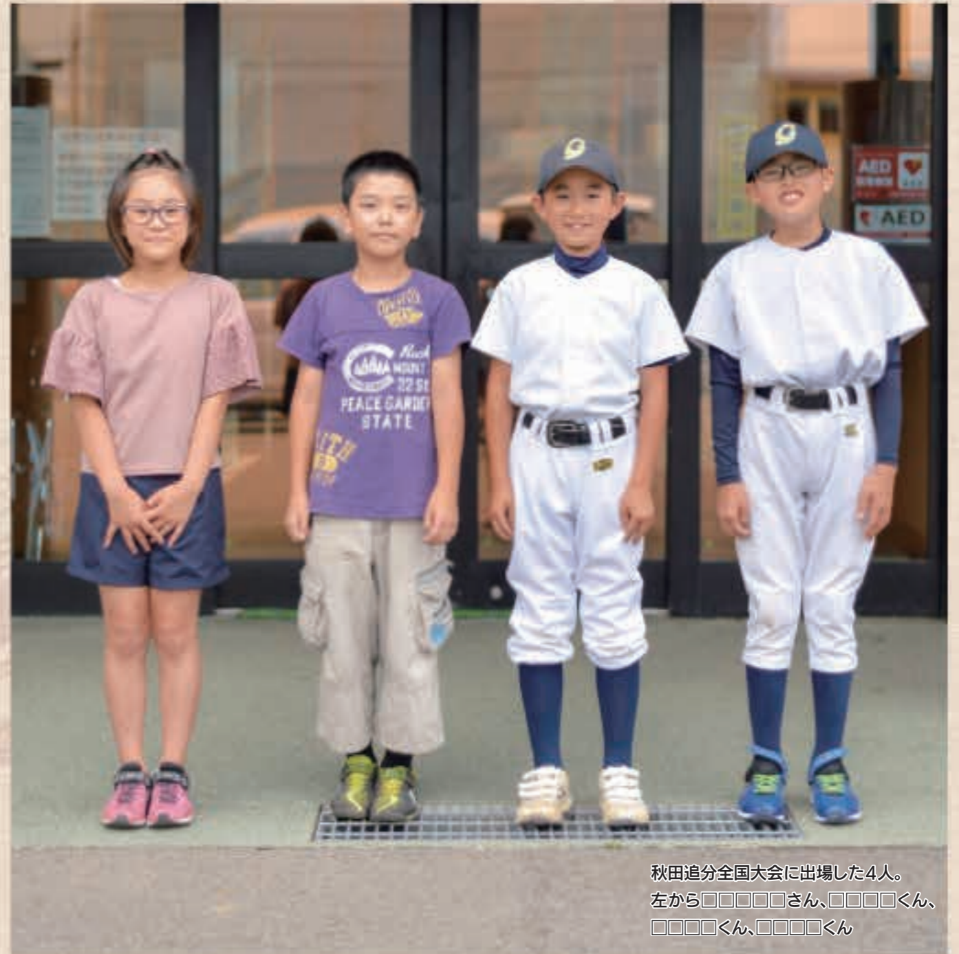
秋田追分全国大会に出場した4人。 左から□□□□さん、□□□□くん、 □□□□くん、□□□□くん