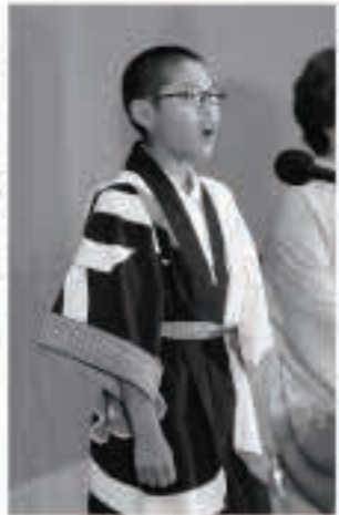
年少の部に出場した □□□□くん(田町)