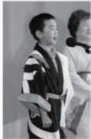
年少の部に出場した □□□□くん(雀館)