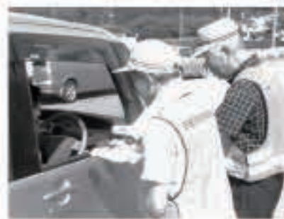
昨年度キャンペーンの様子。

8月は飲酒運転追放強調月間です。夏の交通安全運動がスタートします。夏の行楽のシーズンを迎え、車を運転する機会も増えます。同時に、気候もよく自転車や徒歩での外出も増える時期でもあります。外出の際は、安全運転、安全確認を忘れずに! 町交通安全協会では、8月5日(日)午後2時から、原久商店前(富田)でキャンペーンを実施する予定です。