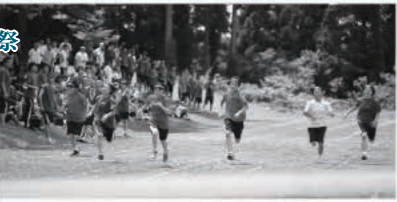
女子100m走のタイム上位者6人で競い合う「女子100mFINAL」

今年のテーマは「物語〜72ページめのヒーロー・ヒロイン」です。各クラスごとに6色の組に分かれた生徒たちは、徒競走、持久走、学年種目やクラス全員でバトンをつなぐ「学級対抗全員リレー」などの種目で競い合い、熱戦を繰り広げていました。