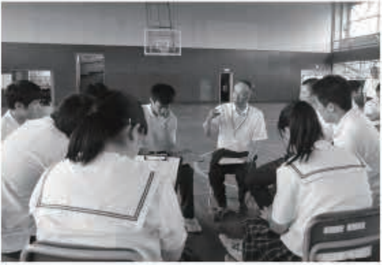
グループには人権擁護委員も加わり、一緒に意見を出し合いました。