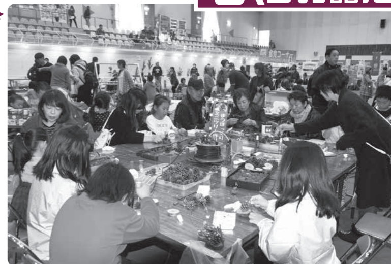
広域五城目体育館と町民センターを会場に開催した産業文化祭には、2日間で約4,500人の来場がありました

11月3日と4日の2日間、「第42回町産業文化祭」を広域五城目体育館と町民センターを会場に開催しました。産業文化祭では、農産物や商工業品の展示や文化展・芸術展などが行われたほか、木育コーナーでは、木を使ったおもちゃ作りのワークショップが開催され、たくさんの家族連れでにぎわいました。11月3日には、産業文化祭褒賞授与式を行い、農産の部、商工業製品など、各部門の中から49点を表彰しました。受賞者・受賞団体は以下のとおりです。