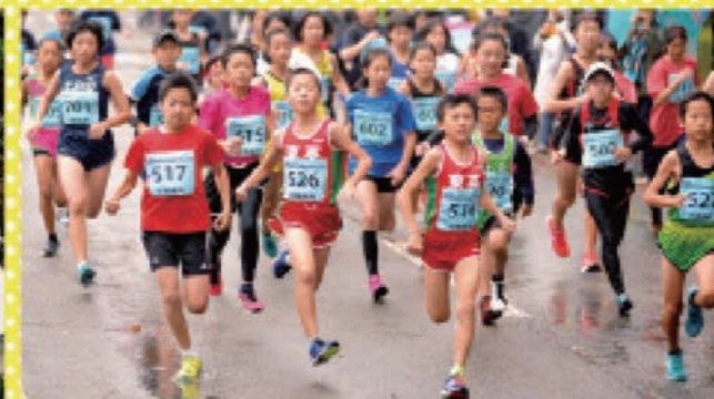
スタート直後から激戦を繰り広げた3kmの部に出場したランナーたち