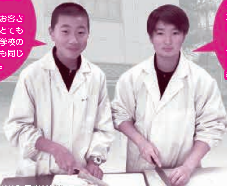
松竹で働いた □□ □□さん④ □□ □□さん④

お客さんに料理を出すときは、丁寧な対応を心がけました。 飲食店の仕事は、お客さんが来る前の準備がとても大事で、このことは学校の勉強や毎日の生活でも同じことだと感じました。