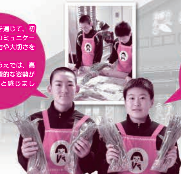
あきた湖東農業協同組合で働いた □□ □□さん④ □□ □□さん④

今回の体験を通じて、初対面の人とのコミュニケーションのとり方や大切さを学びました。 また、働くうえでは、高い集中力と積極的な姿勢が大事なことだと感じました。