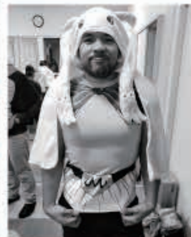
パーティでは、ドラゴンボールZのお気に入りのキャラクター、「魔人ブウ」の仮装をしました。

冬が近づき、厚着をする時期です。五城目は周辺の町や市に比べ、雪がたくさん降ると聞いているのでわくわくしますが、少し不安です。