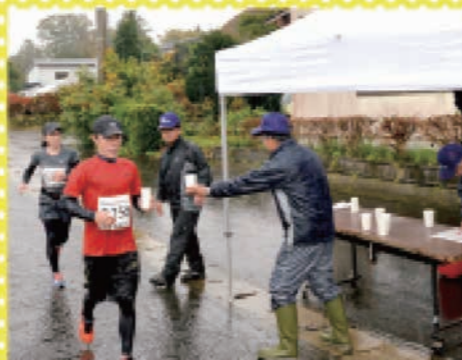
地元のボランティアがランナーをサポート