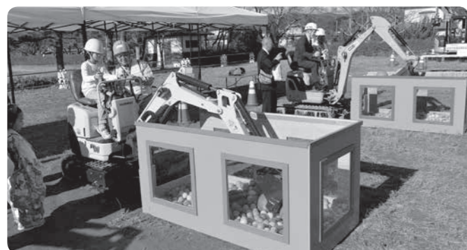
ミニバックホーでボールすくい体験