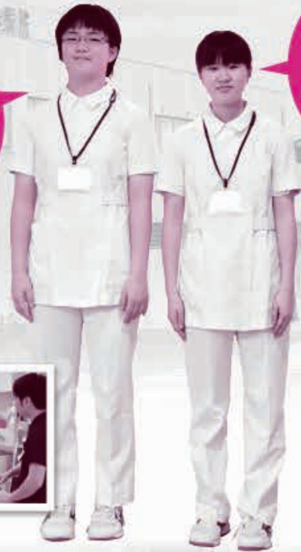
湖東厚生病院で働いた □□□□さん④ □□ □□さん④

スタッフの方たちは、患者さん一人一人のけがや体調に合わせ、細かいことに気を配りながら接していました。その姿を見て、常に周りの人のことを考え、対応することが仕事をするうえで大切だと学びました。