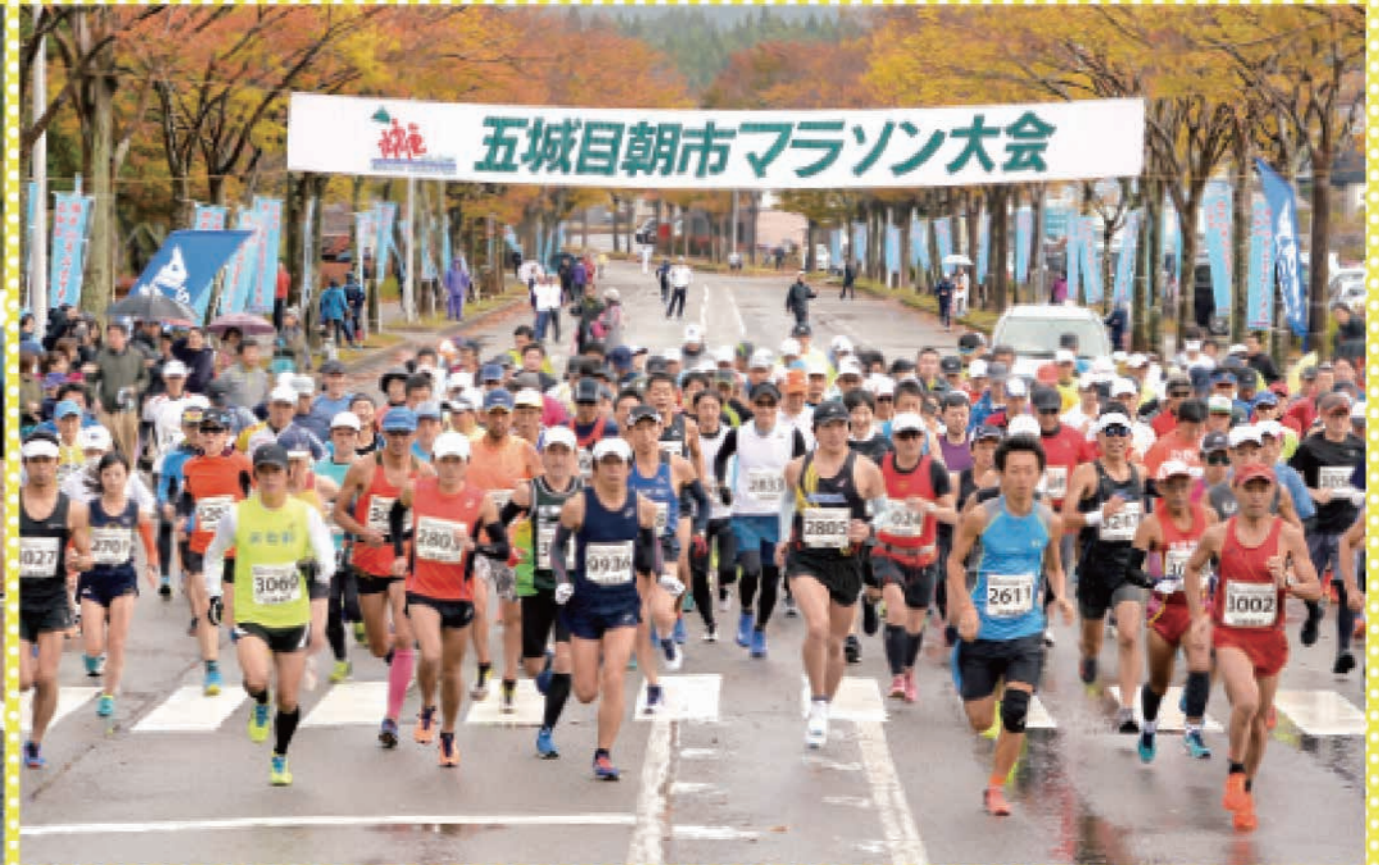
ハーフの部に出場した227人が、雀館運動公園前を一齐にスタート