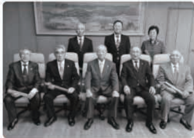
町内からは、2個人と2団体に表彰状が贈られました