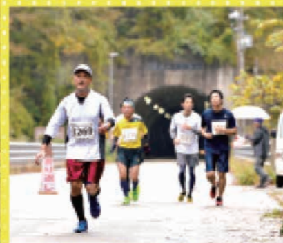
保呂瀬トンネルがハーフの折り返し地点