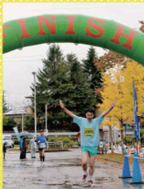
最後はポーズを決めながらゴール!