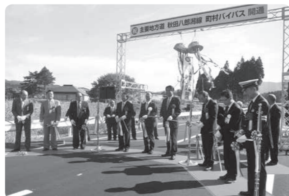
歴代町村町内会長や町内会の皆さんも出席し、開通を祝いました

10月26日、県が平成25年度から整備を進めてきた「県道秋田八郎瀧線町村バイパス」が開通しました。供用開始に先立ち開催された開通式典では、テープカットやパレードが行われました。この区間の現道は、住宅が密集する町村町内中心部を通り、見通しの悪い急カーブや狭い幅員などから、車両と歩行者のどちらにも危険の多い箇所でした。今回整備された町村バイパスは、住宅密集地を迂回する片側1車線の道路で、カーブが緩やかになり、幅員も広がりました。