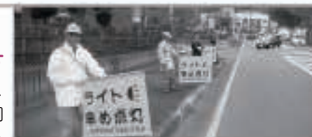
町交通指導隊、町交通安全母の会の協力で、町交通安全協会による「4時からライト」運動を役場前で実施しました

飲酒運転は、運転手はもちろん、車両提供者、同乗者、また飲酒検知を拒否した場合も刑事罰に問われます。また、自転車の飲酒運転の場合も重い罰則が科せられます。