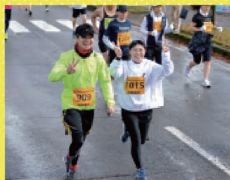
ランナーの皆さんのさわやかな笑顔が、大会を彩りました