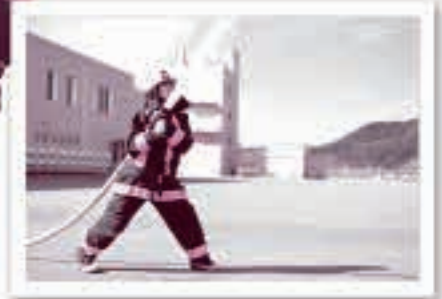
五城目消防署で働いた □□ □□さん④ □□ □□さん④ □□ □□さん④

地域の人を守るために活動する消防士たちの姿は、とても頼もしかったです。その姿を見て、誰かのために頑張りたいという気持ちになりました。