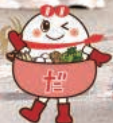
五城目町観光PRキャラクター たまごちゃん