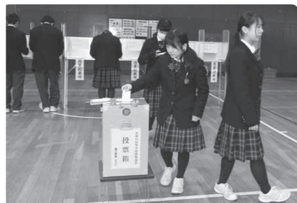
18歳になると、投票ができます

11月3日、最新の建設機械を体験できる「建設ふれあいフェア」が雀館運動公園と旧恋地スキー場で行われました。雀館運動公園では、ドローン(無人航空機)やミニバックホーの操縦体験や除雪車、町のコミュニティバス「きやどっこ号」が展示されました。旧恋地スキー場では、最新の油圧ショベルの操作体験が行われました。