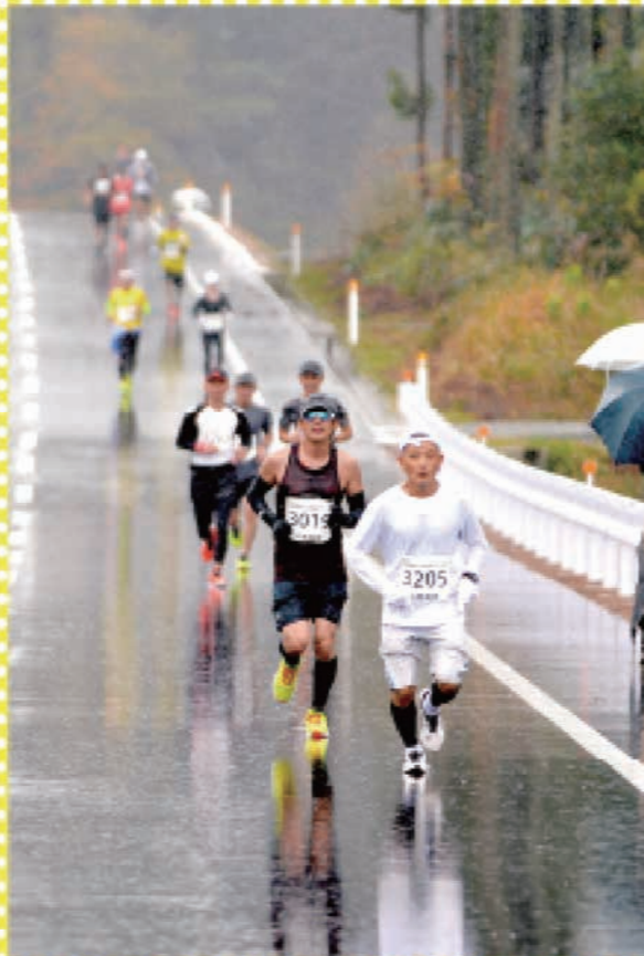
開通直後の町村バイパスを力走