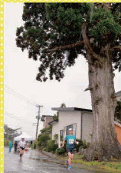
帝釈寺の一本杉もランナーたちを見守ります