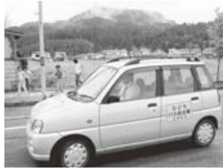
公用車でパトロール中

5月22日から、役場職員でパトロールチームを編成し、各小中学校の下校時間に合わせて、通学路の巡回を行っています。