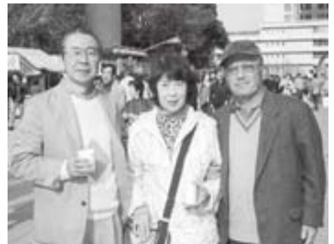
「さくらまつり」靖国神社にて (左から●●さん、実姉の●●さん、先輩の●●さん)

今、秋田の観光地図を広げながら、改めて、秋田のすばらしさを再認識しているところです。本当に有意義な、充実した秋田での生活でした。