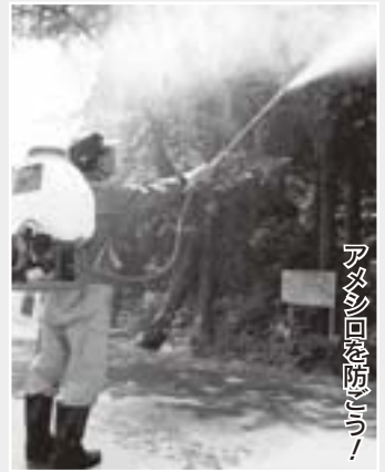
アメリロを駆除しよう!

アメリロ防除機(アメリロ)の幼虫は、樹木の葉を手あたりしだいに食いあらず害虫です。役場農林課では、町内会に無料で防除機を貸し出しています。薬剤と油は無料で提供しますので、ぜひご利用ください。 ▼防除機 背負動力噴霧機(薬剤や油も無料で配布) ▼申し込み 役場農林課(☎852-5236)に電話予約し、借用申込書に記入してください。※準備している防除機は二台です。早めご予約してください。