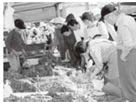
朝市まつりには3,000人が訪れた

大会in馬場目川2006が四月二十九日に開催されました。今年で十三回目の開催となる同大会には、北は青森県、南は神奈川県から三十四人が参加。釣り上げたイワナとヤマメ三尾の体長の合計を競いました。