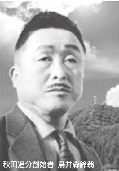
秋田追分創始者 鳥井森鈴翁

秋田追分全国大会は、秋田追分の生みの親である故鳥井森鈴氏の正調秋田追分の正しい伝承と保存、そして普及を目的としています。 入場は無料です。旅行クーポン券やあきたこまち、朝市パックなどが当たる抽選会もあります。 ※お問い合わせは、秋田追分全国大会実行委員会事務局 (01052・5222) まで