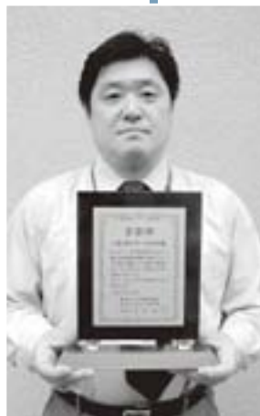
平成17年度県内唯一の表彰となりました

十九年結成以来、長年にわたり団員の健全育成や組織強化に努めてきたことや、二十八回を数える県スポーツ少年団水泳種目別大会を町屋内温水プールで開催している