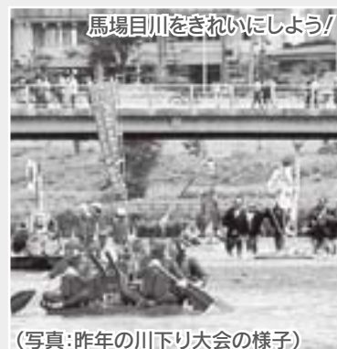
(写真: 昨年の川下り大会の様子)