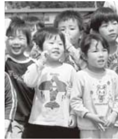
現況届を忘れてはダメ

現況届の提出がないと、六月分以降の手当が受けられなくなりますので、ご注意ください。