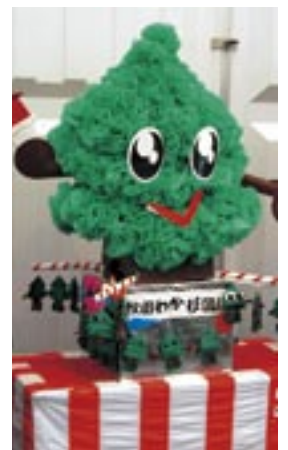
五城目保育園のおともだちが作ってくれたスギツチ