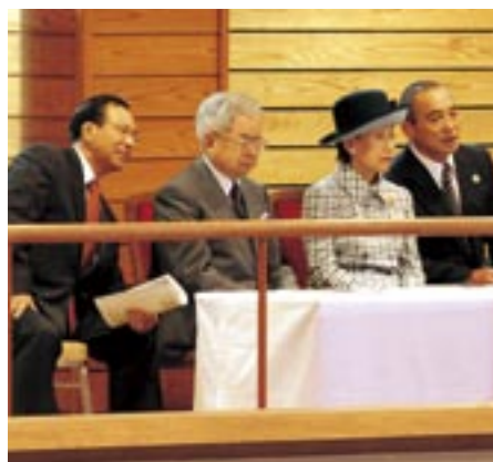
レスリング競技を観戦なさる両陛下