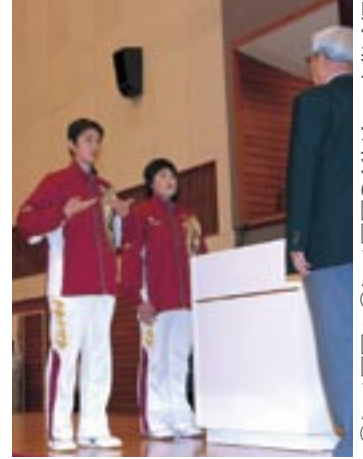
選手宣誓を行う 県代表チーム主将の□□さんと□□さん