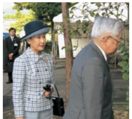
体育館に入られる両陛下