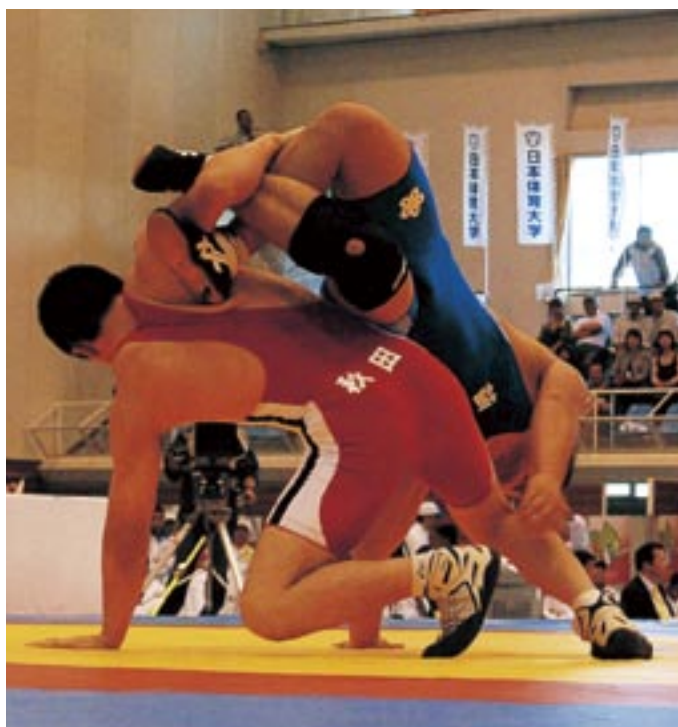
□□選手の得意技、アングルホールド