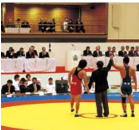
両陛下の前で県選手が見事勝利

常陸宮殿下・同妃殿下 レスリング競技をご観戦 十月五日、常陸宮殿下・常陸宮妃殿下が、秋田わか杉国体レスリング競技会にご観戦のため町を訪れました。 両陛下はフリースタイル二回戦の試合をご観戦され、選手たちの熱戦に拍手を送られていました。