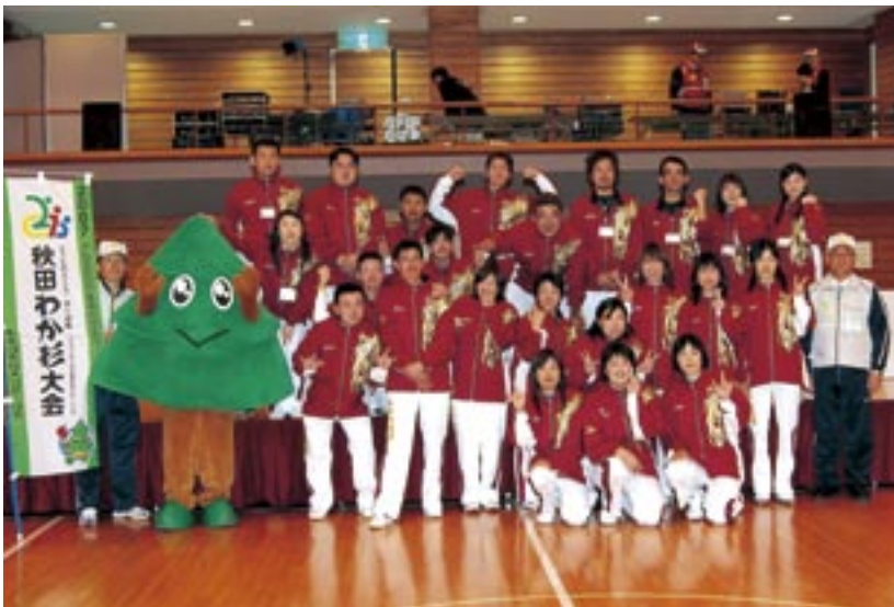
県代表チームの皆さん、お疲れ様でした