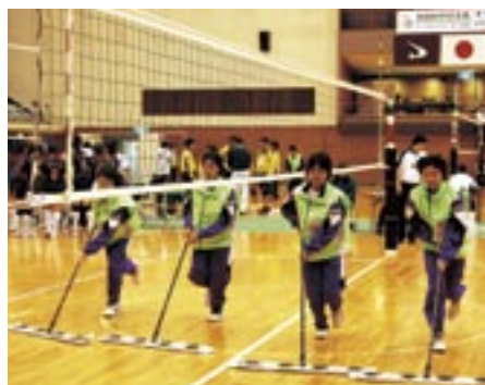
式典や競技の運営では、五一中女子バレーボール部の皆さんが大活躍