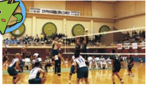
熱戦が繰り広げられた会場