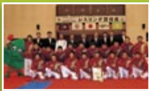
県レスリング選手団の皆さん