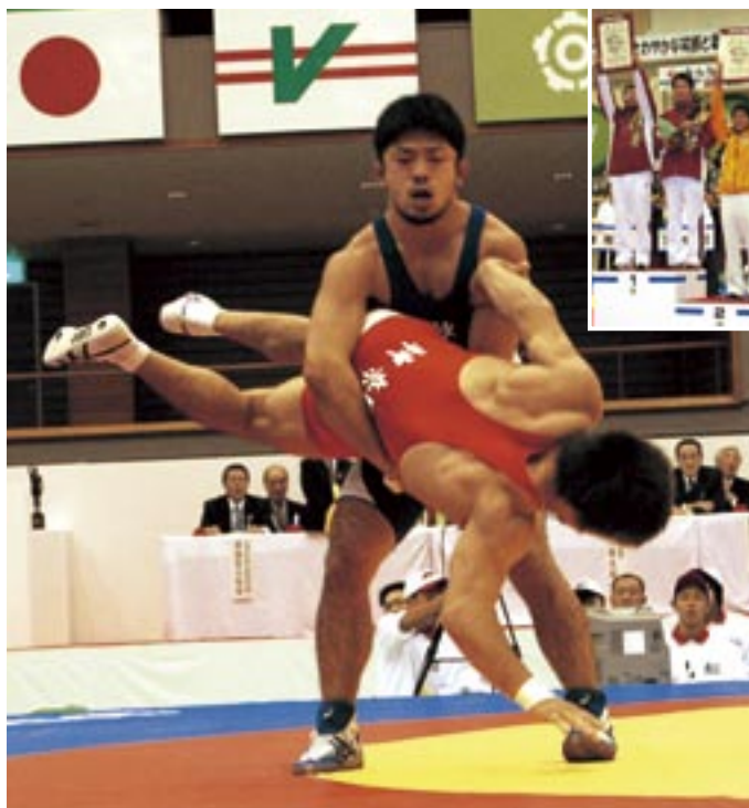
相手選手を持ち上げる□□選手(グレコローマン66kg級)

10月5日から8日までの4日間の日程で行われたレスリング競技会(成年男子)では、7人の県代表選手が出場。優勝した2人を含め、全員が3位以内に入賞する活躍を見せ、見事総合優勝を果たしました。