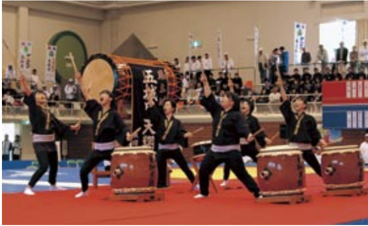
開始式で登場した五城目天翔太鼓の皆さん「天翔祝太鼓」で、開催をお祝いしてくれました

レスリング競技会の開始式と総合表彰式では、町のイベントでおなじみの2団体が登場。太鼓の音と楽しいダンスでお客さんを歓迎しました。