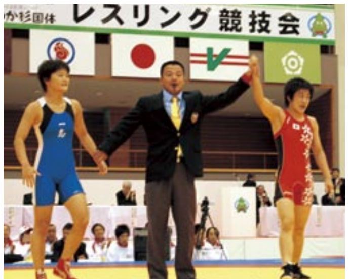
□□選手(右)と対決した□□□□さん(左:潟上市出身)