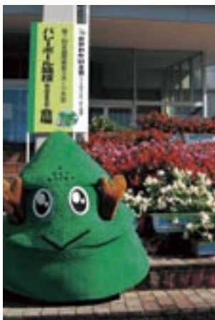
会場に設置されたプランターの小花

秋田わか杉国体・わか杉大会の競技が行われた7日間で、会場となった広域五城目体育館には選手や関係者、観客など約18,000人（主催者発表）が訪れました。