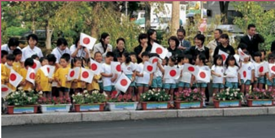
役場前で両陛下をお迎えした園児たち