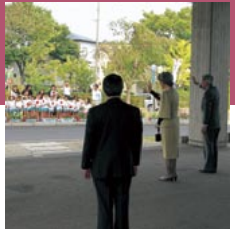
歓迎にお応えになる両陛下