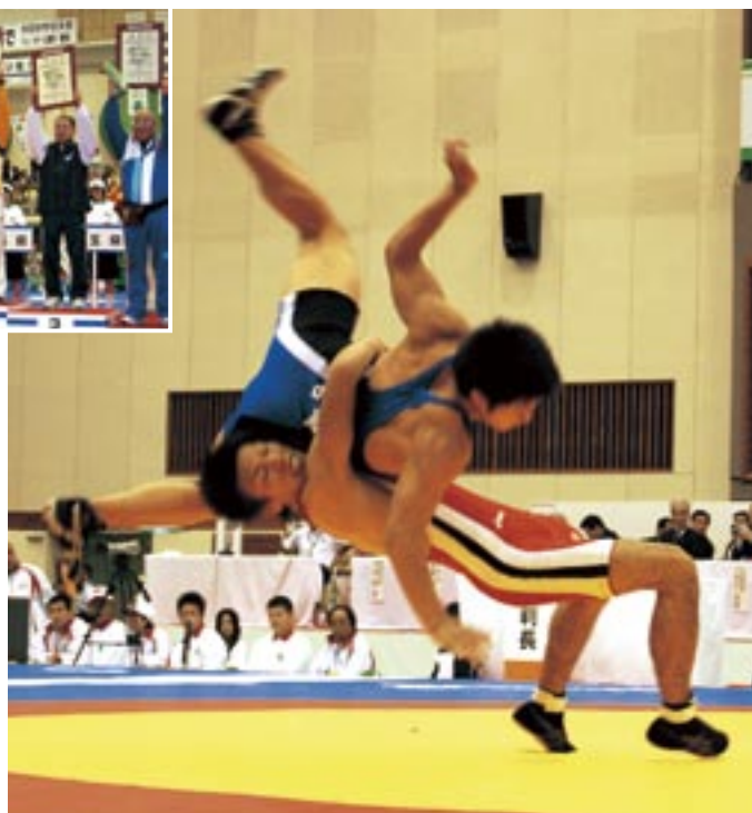
豪快な投げ技を放つ□□選手(グレコローマン60kg級)