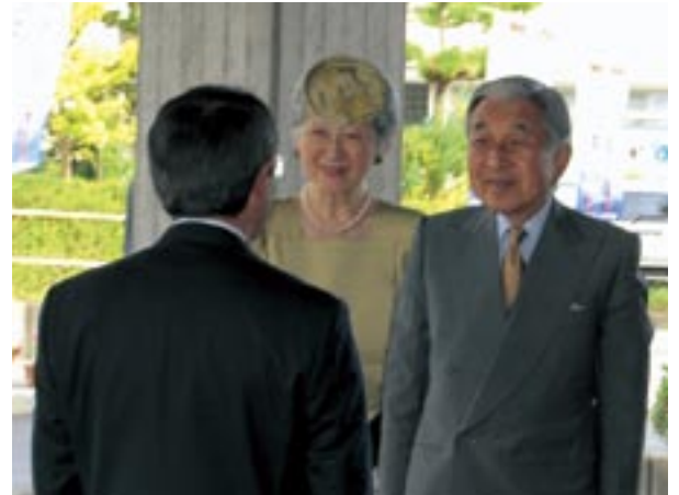
はじめに町長がお迎えしました