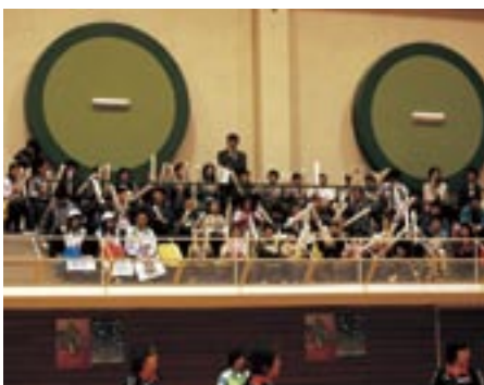
馬小のおともだちも、応援サポーターとして活躍してくれました