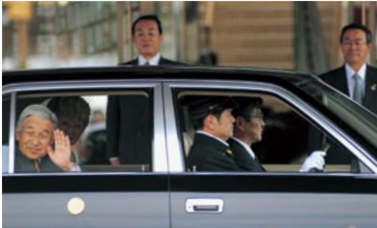
車内から歓迎にお応えになる両陛下