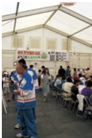
たまご鍋や豚汁が振舞われたふれあい広場