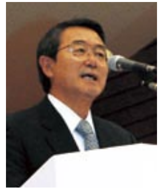
五城目町長 渡邊 彦兵衛

期間中は、選手たちの素晴らしい戦いとともにご歓迎ムードを盛り上げるため、沿道や会場周辺を花いっぱい飾るプランニング競技会開始式