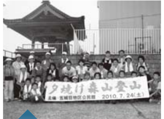
森山の山頂で記念撮影

八月六日、本町部の子どもたちが手作りの絵灯ろうを引いて町内を練り歩く、「五城目地区公民館七夕まつり」が行われました。今回の七夕まつりに