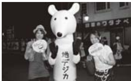
地デジへの切り替えはお早めに！