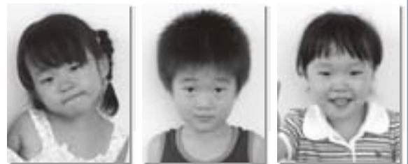
□□□□□ちゃん (□ □) □□ □□くん (□□□) □□ □□ちゃん (□□□)

3歳は心身が発達するうえで、とても大切な年齢です。この時期に乳歯の歯列はほぼ完成するので、ご家庭で協力しあい正しい歯磨きを心がけてください。