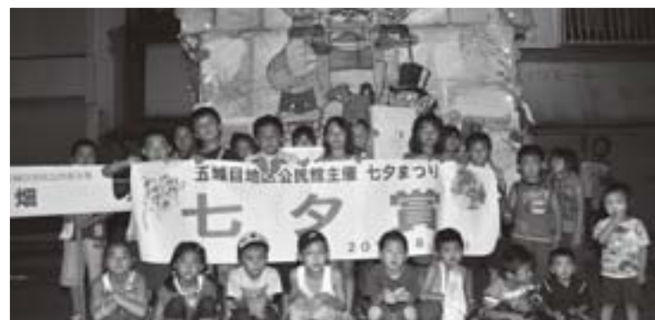
見事七夕賞に輝いた畑町の子もたち

当日は山頂付近に霧が発生し、残念ながら夕焼けを見ることはできませんでしたが、涼しい風が吹き抜ける山頂で歌を歌ったりしながら、夏の森山登山を楽しみました。