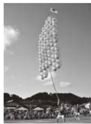
目の前で見る本場の竿燈に大きな歓声が上がる