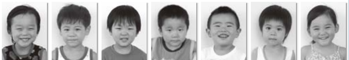
□□ □□くん (□ □) □□ □□くん (□□□□) □□□□□くん (□□□□) □□ □□くん (□□□) □□□ □□くん (□□□) □□ □□くん (□□□) □ □□ちゃん (□□□□)