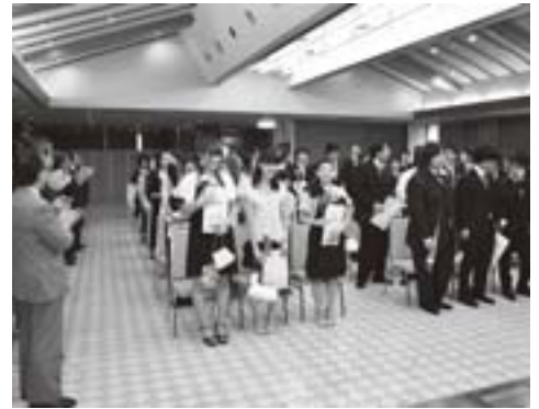
実行委員長の ○○○○さん（○○○○）

その後、中学時代の恩師である畠山先生と笹淵先生のスピーチに引き続き、新成人を代表して○○○○さん（○○○○）と○○○○さん（○○○○）がステージに上がり、「自ら考え行動し、信頼される大人になれるよう努力していきます」と、渡邊町長に力強く誓いの言葉を述べました。