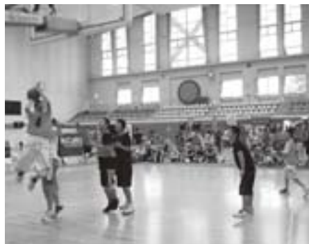
ストリートバスケット大会