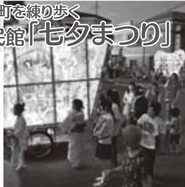
夜道に映える手作りの絵灯ろう

八月六日、本町部の子どもたちが手作りの絵灯ろうを引いて町内を練り歩く、「五城目地区公民館七夕まつり」が行われました。今回の七夕まつりに