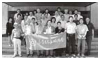
役場前にて記念撮影

三日間を通じ、五城目町の皆さん には大変お世話になりました。特に 岩野、下山内、 町村、帝釈寺 の各町内会の 皆様には盆踊 り大会に温か く歓迎して頂 きました。心 からお礼申し 上げます。