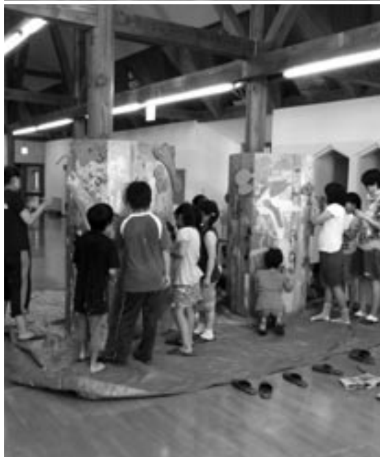
みんなで水族館のオブジェを制作