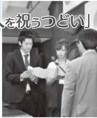
誓いの言葉を述べる ○○○○さん（○○○○）と○○○○さん（○○○○）

八月十五日、町民センターで「新成人を祝うつどい」が行われ、今年成人となる百七人のうち七十八人が出席し、成人を祝いました。つどいは実行委員長の○○○○さん（○○○○）の○○○○さん（○○○○）の○○○○さんの○○○○（○○○○）の開式のことばで幕を開け、続いて渡邊町長が祝辞を述べました。