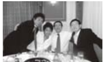
第22回総会にて、町長を囲む、会長とリリーズ選手の二人。

新年を迎え、役員一同は会員相互の親睦交流活動を第一に、五城目町の物販活動として千代田区との橋渡し役として微力ではありますが、全力で取り組んでまいりますので、なお一層の御指導・御鞭撻をお願い申し上げます。おわりに、会員御家族皆様・関係各位の皆様のご多幸・御栄進と五城目町・千代田区の益々の御発展・御繁栄を心より御祈念し新年の挨拶とさせていただきます。