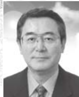
五城目町長 渡邊 彦兵衛