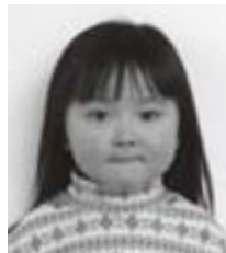
□□ □□ちゃん (□ □)