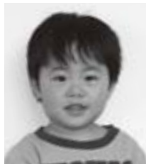
□□ □□くん (□ □)