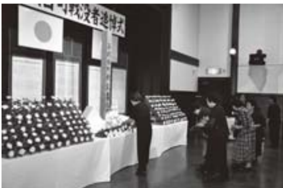
献花をささげるとご遺族の皆さん

8月18日、五城館で「町戦没者追悼式」が行われました。 戦後66年を迎えた今年は、町内から約70人が参列。黙とうの後、537柱の英霊に献花をささげ、戦没者のめい福を祈るとともに、世界の平和をあらためて誓い合いました。