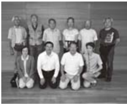
来町された「ちよだ文化連盟」の皆さん

今回の作品展には、同会の作品18点のほか、10年ほど前から交流があるという姉妹都市千代田区のグループ「ちよだ文化連盟」の作品16点も合同展示。また、開始日の8月14日にはちよだ文化連盟の7人の皆さんが来町され、それぞれお互いの作品を鑑賞し、意見交換をしたりしながら交流を深めていました。