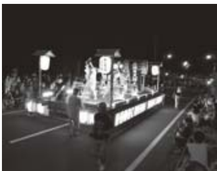
光のパレードは中央線で開催