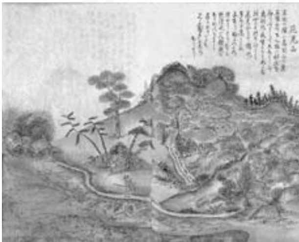
【図絵・花見山（高岳山）「霞む月星」】