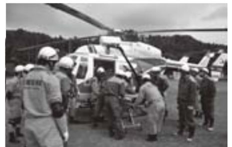
防災ヘリでの救急搬送時の連携を確認