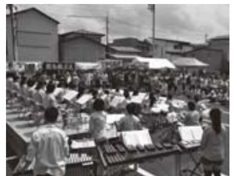
今回も吹奏楽部の演奏でスタート