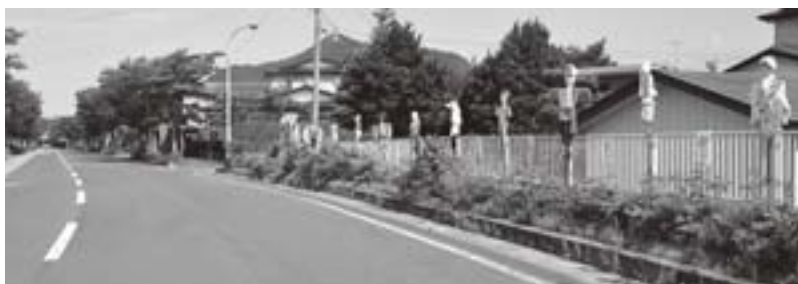
県道の歩道脇に並ぶ「かかし」

15体の「かかし」にはそれぞれ、胸の部分に同病院への思いを記したメッセージを掲示。会員の皆さんによると、「主婦の立場からの思いを、より直接的に表現したかった」とのことです。また、「明日は我が身という思いもあり、自分たちにも何かできたらと考えていた。これを発端に、病院を守る活動がより広まってくれたらと思う」と語ってくれました。