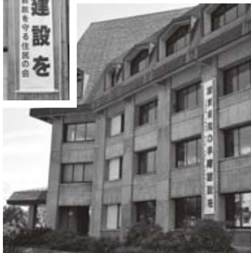
町役場には2つの垂れ幕を設置しています

垂れ幕は当町のほか、湖東病院周辺の八郎瀧町・井川町・大瀧村の計4町村に配られ、それぞれの役場庁舎に設置されています。