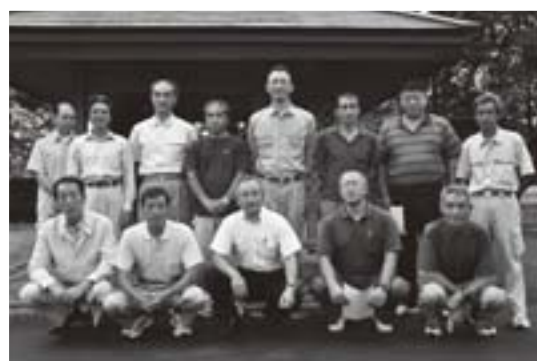
五城目建築業協会の皆さん