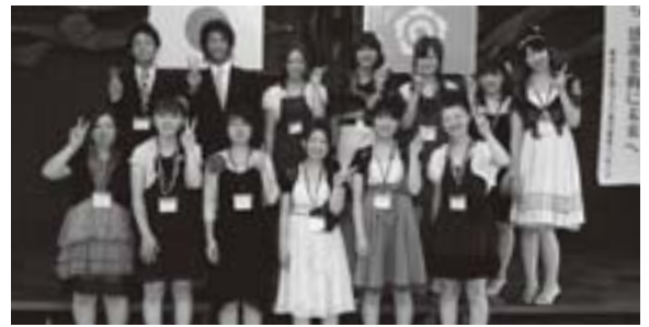
実行委員の皆さん、お疲れさまでした