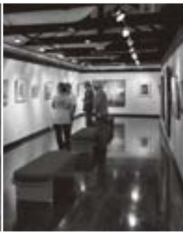
幅広い作風の絵が並びました