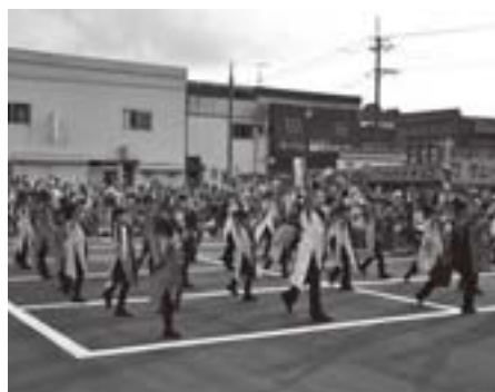
毎年人気のダンスショー