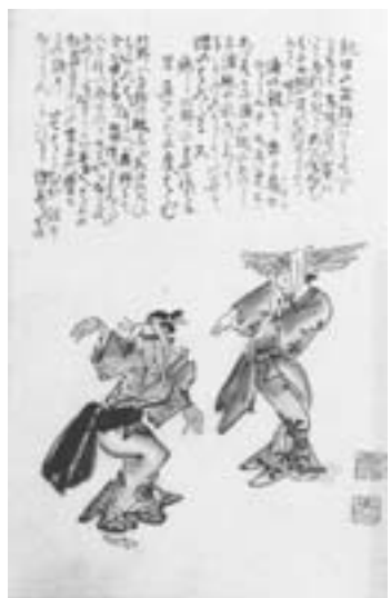
【図絵・盆踊り（ひなの遊び）】

また、「菅江真澄遊覧記」には、「塊齋（魂まつり）をする8月13日の夕べから20日の夜にかけて盆踊りが行われる。その踊りにいろいろある。「あねこもさ」・「柚子おどり」・「ばらばら踊り」。