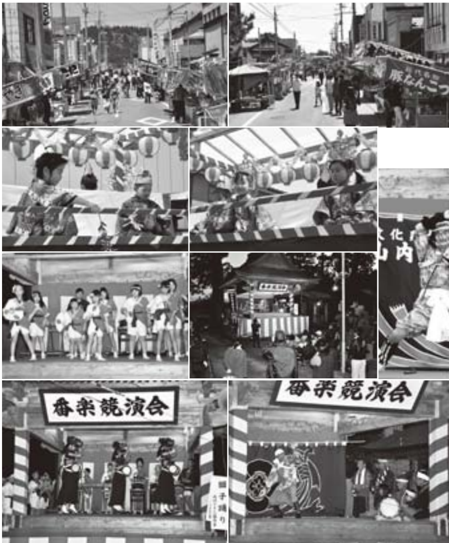
番楽競演会では「山内番楽」「中村番楽」「内川こどもさら」の3団体が出演

5月19日は五城目神明社の神楽殿で勇壮な舞を披露する「番楽競演会」が、そして20日は本町部祭典と大名行列が行われ、連日町内外からの買い物客や見物客でにぎわいました。