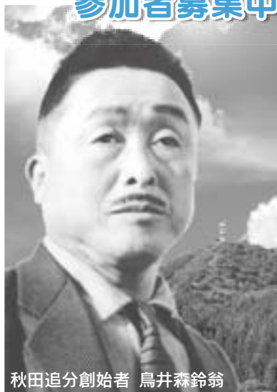
秋田追分創始者 鳥井森鈴翁

秋田追分全国大会は、秋田追分の生みの親である故鳥井森鈴氏の正調秋田追分の正しい伝承と保存、そして普及を目的としています。 入場は無料です。ぜひご来場ください。 ※お問い合わせは、秋田追分全国大会実行委員会事務局 (☎0192・5222) まで