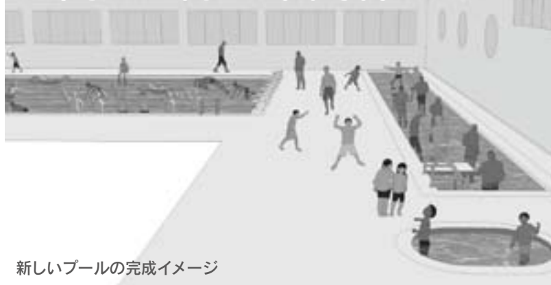
新しいプールの完成イメージ