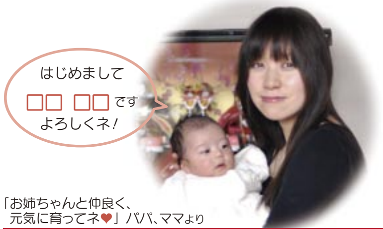
「お姉ちゃんと仲良く、元気に育ててネ♥」パパ、ママより