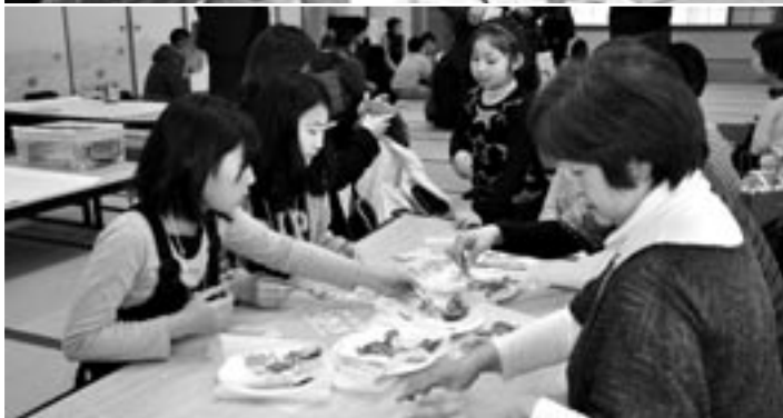
講座の様子(囲碁・将棋①、絵画②、押し花③)