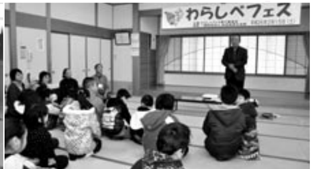
はじめに 草皆運営委員長があいさつ