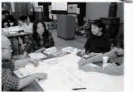
▲朝市大学で、地域活性化のアイデアを出し合うワークショップを開催

新年あけましておめでとうございます。協力隊3人、本年もますます精進して参ります。どうぞよろしくお願ひいたします!