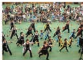
▲ 8月15日 きやどっこまつりは荒天のため、広域五城目体育館で開催しました