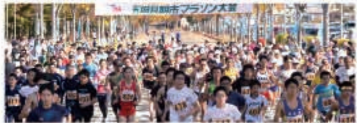
▲ 10月26日 五城目朝市500年記念マラソン大会が開催され、1,098人のランナーがエントリーしました