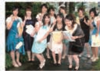
▲ 8月15日 五城館で新成人を祝うつどいを行い、119人が大人の仲間入りしました