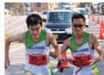
▲ 9月28日 第1回秋田市町村対抗駅伝で町チームが町の部第5位入賞

昨年、広報ごじょうめはいろいろな行事や話題などをお伝えしてきました。主なものを集め2014年を振り返ります。今年も広報紙の編集にご協力くださいますようお願いいたします。