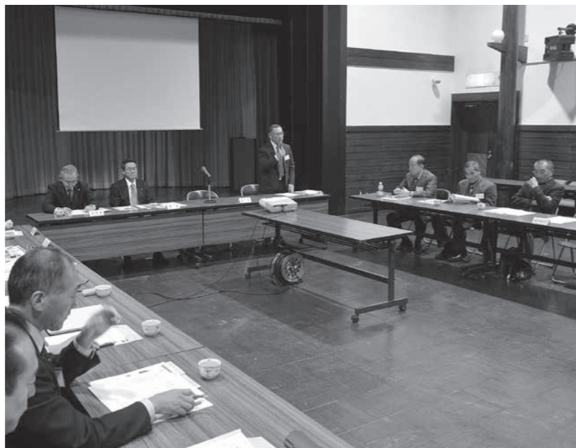
五城目地区26町内会のうち17の町内会長が出席し、地区全体に渡る課題や要望などを話し合った町内会長会五城目地区協議会