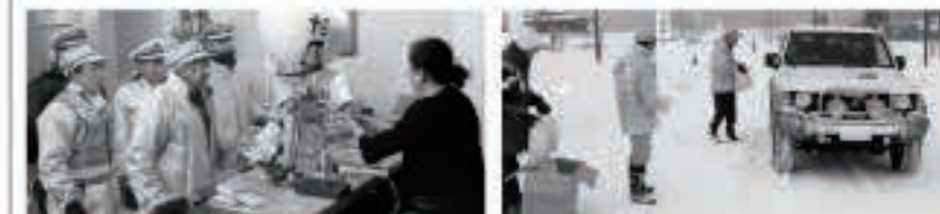
町交通安全協会では、12月5日に飲食店巡回訪問(☎)。町交通安全指導隊、五城目警察署の協力で12月14日に年末の交通安全キャンペーン(☎)が行われました

緊急時以外の相談・連絡などには、警察相談専用電話(☎864・9110または#9110)をご利用ください。