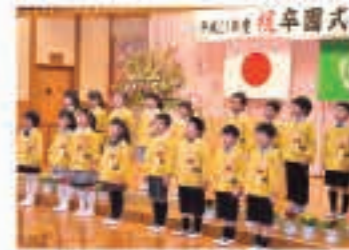
▲ 3月18日 五城目幼稚園最後の卒園式を行いました。