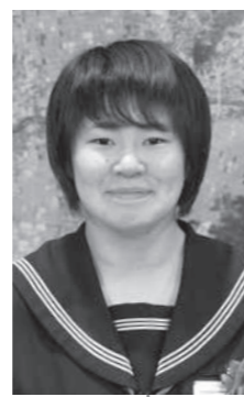
秋田北地区納税貯蓄組合連合会長賞 ○○○さん（五・中3年）

中学生の税についての作文コンクール 今月号では、秋田北地区納税貯蓄組合連合会長賞を受賞した○○○さん（五・中3年）の作品を紹介します。