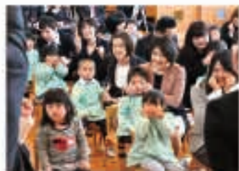
▲ 4月5日 認定こども園「もりやまこども園」初の入園式が行われました