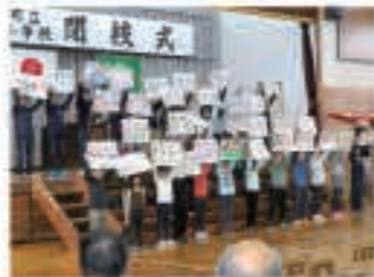
▲ 11月16日 2015年3月で閉校する大川小閉校式典を開催。全員で夢を発表しました