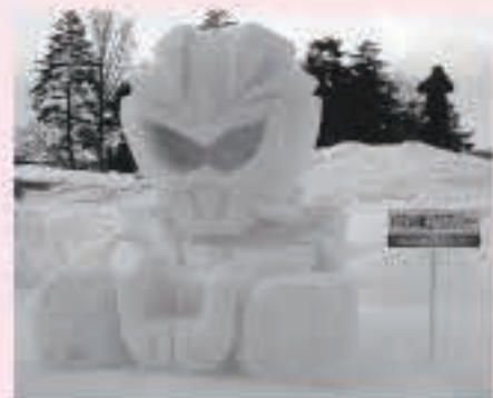
上杉雪灯籠まつりの米沢ご当地ヒーロー「アズマンジャー」の雪像

五城目町に来たばかりでまだまだ分からないことばかりですが、町内会の行事やワークショップを通して町内の方とかかわり、「元気なムラづくり」の力になればと思います。これから五城目での生活を楽しみながら活動していきます。地域おこし協力隊の方とはまた違った形で町内の方々とかかわっていきますので、よろしくお願いします。