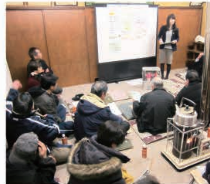
▲ 未来づくりプログラム・五城目プロジェクトによる町内会ワークショップを開催し、それぞれの町内会でビジョンを策定しています。そのビジョンに基づいて、町内会活動も進められています。