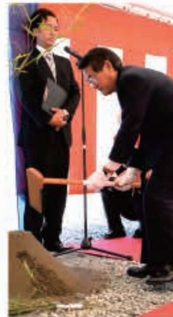
▲ 9月27日 消防庁舎の建設にあたり、安全祈願祭を開催（下山内）