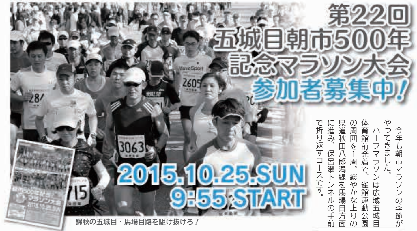
錦秋の五城目・馬場目路を駆け抜けろ!

今年も朝市マラソンの季節がやってきました。ハーフマラソンは広域五城目体育館前発着で、雀館運動公園の周囲を1周。緩やかな上りの県道秋田八郎瀧線を馬場目方面に進み、保呂瀬トンネルの手前で折り返すコースです。