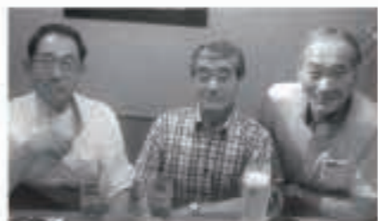
内川中の同期生と。中央が私です。

がチヨロチヨロ流れ落ちる小さな水飲み場が数多くありました。上京するまではミネラルたっぷりの山の天然水を飲み、その水で炊いたご飯を食べて育ったものです。 我が秋田の五城目町も含めて減反や人口減、さらには少子高齢化が進んで棚田の作付けも見かけなくなり寂しい想いです。 ところで、私の現住地、埼玉県川越市内のお店に「あきたこまち」が販売されており、お米の袋には秋田県の地図と産地の農協名が記載され、そこは雄物川沿いの仙北地方でした。五城目産も流通拡大、いつか店頭に並べば「ふるさと」を味わうことができると思っております。