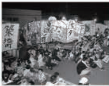
町内を巡った色とりどりの絵灯ろう

8月6日、子どもたちが手作りの絵灯ろうを引いて町内を巡る、「五城目地区公民館七夕まつり」が行われました。今回の七夕まつりには、8団体による色とりどりの絵灯ろうが登場しました。審査の結果、3年連続で東磯ノ目町内会が「七夕賞」を受賞しました。