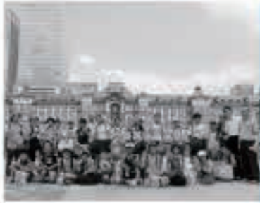
昨年開業100周年を迎えた東京駅

8月7日から3日間、「五城目町・千代田区児童双方向交流事業」が行われました。6年目となる今年は、両自治体の小学生34人、交流支援員ら15人が参加し、これまでで最大規模の交流となりました。千代田区のご家庭でのホームステイや東京都内の見学などが行われ、ホテルニュー