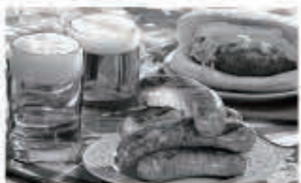
ソーセージをおつまみにドイツビールを楽しみます

オクトーバーフェストはドイツが起源のお祭りです。その祭りでは、ドイツだけで出されている様々なビールがあり、それらを楽しむことができます。家族向けにたくさん楽しいライブパフォーマンスがあり、子ども向けのゲームもあります。オクトーバーフェストはアメリカだけでなく、ほかの国々でも同じようにドイツの祭りをお祝いします。