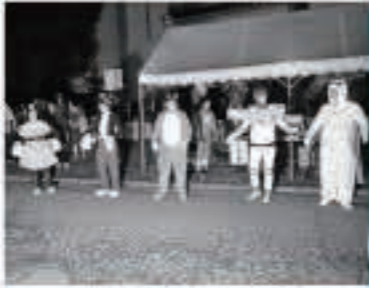
団体の部で優勝したもりやまこども園チーム

きやどっこまつりに引き続き、町民センター前で全町盆踊り大会が開催されました。町内企業や各種団体、町内の皆さんなど10団体と6個人の約300人が参加。おそろいの着物やユニークな衣装を身にまとい、会場いっぱい踊りの輪を広げました。