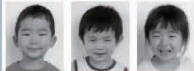
□□ □□くん (岡本1区) □□ □□くん (下山内) □□ □□ちゃん (大川4区)

国民健康保険からのお知らせ 10月1日(木)からは 新しい保険証で 新しい保険証(被保険者証)を9月中に郵送します。内容をご確認いただき、10月1日(木)以降は新しい保険証をお使いください。 保険証(被保険者証)は、国保加入者であることを確認できる唯一の証明書です。次のことを必ずお守りください。 ▼通院や入院の際は、必ず病院(保険医療機関)等の窓口へ提示してください。