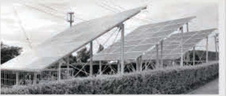
写真は、町民センターに設置された太陽光パネル

平成15年3月に閉校した富津内小学校跡地は、その恒久的な利活用方法が見えないまま、工事の仮設事務所設置や残土置き場として利用されていましたが、この度、大規模太陽光発電事業の誘致が決定しました。 町では、今後20年間跡地を事業者（五城目ソーラー株式会社）へ貸し付け、事業者が発電事業を行います。これにより、町は貸付使用料や固定資産税などの収入を見込んでいます。