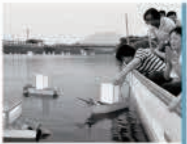
漁船に乗り川の中ほどで小舟を流す大川のねぶ流し

8月6日、大川地区で「ねぶ流し」が行われました。太鼓の音が響く中、漏船をかたどった小さな舟を馬場目川に流します。ねぶ流しは、初盆を迎える家などが小舟を流し、先祖や亡くなった家族を供養する大川地区の習わしです。