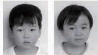
□□ □□くん (紀久栄町) □□ □□くん (新町)

「三つ子の魂百まで・・・」といわれますが、3歳は心身の発達上、節目となり極めて重要です。 この時期に乳歯の歯列はほぼ完成するので、家族みんなで協力しあい、正しい歯の健康維持について基本を身につけましょう。