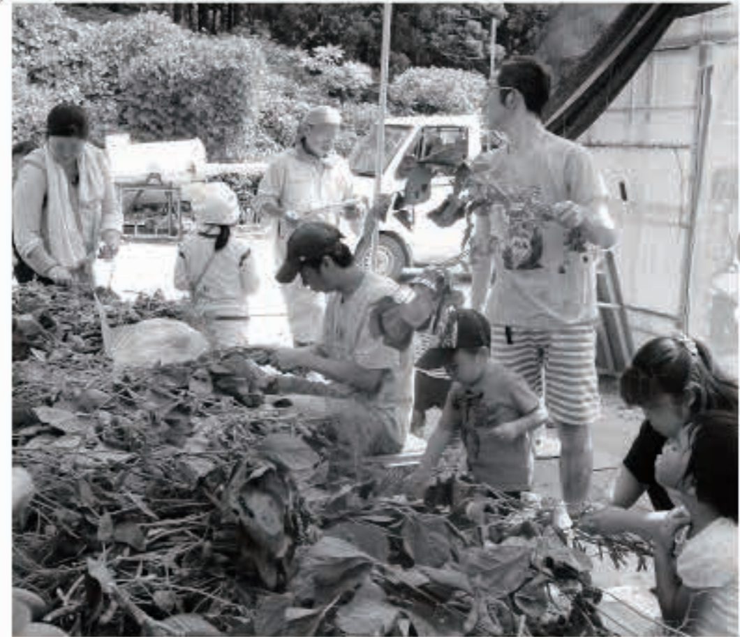
大人も子どもも頑張った茎からの枝豆のもぎ取り