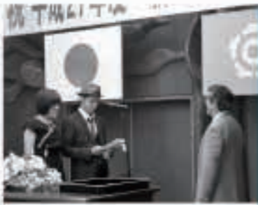
誓いの言葉を述べる□□□□さん(□□□)と□□□□さん(□□□)

8月15日、町民センターで「新成人を祝うつどい」が行われ、今年成人となる77人のうち58人が出席し、成人を祝いました。新成人を代表して□□□□さん(□□□)と□□□□さん(□□□)が「強い意志と責任感を持ち、これからの人生を歩んでいく」と誓いました。