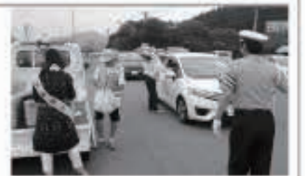
8月2日交通安全を呼びかけた夏の交通安全キャンペーン

秋の全国交通安全運動がスタートします。夕暮れが早くなってくるこの時期、歩行者や自転車の見落としによる事故が増える時期でもあります。 ドライバーの皆さんはもちろん、歩行者や自転車の皆さんも反射材を身につけるなど、交通事故防止に努めましょう。