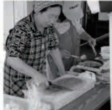
人気の旬のミズたたきや試食会