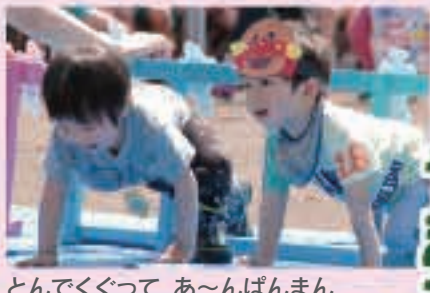
とんでくぐって、あ〜んぱんまん