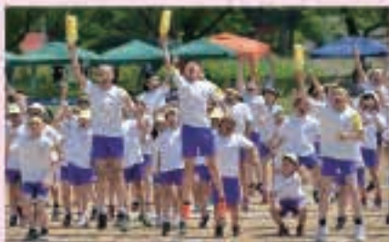
心一つに声を響かせた応援合戦