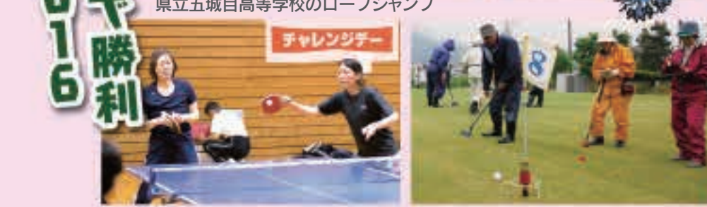
そーれ スマッシュ!