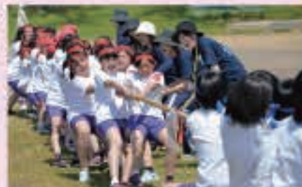
みんなの力を合わせて綱引きヨイショ