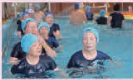
新しいプールで人気の水中運動