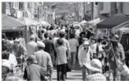
朝市plus+の開催でにぎやかな朝市通り