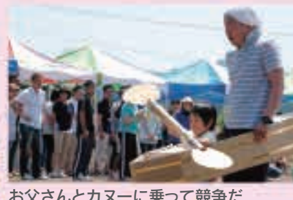
お父さんとカヌーに乗って競争だ