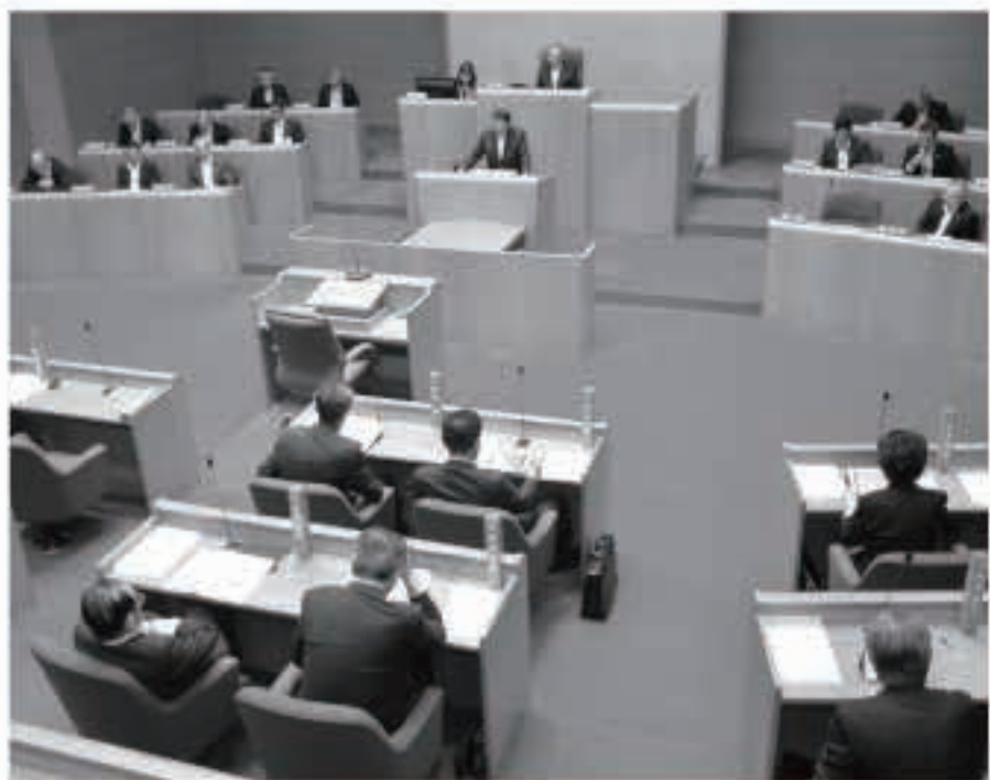
ペーパーレス化、例規集簿冊の廃止に伴い、県内初のタブレットを導入。6日間の日程で、9件の案件などを審議し、可決した6月議会定例会

従来の山菜や農水産物を扱う出店に、ハンドメイドのバッグやアクセサリー、お菓子やお酒などこれまでなかった商品を加わったことにより、普段の