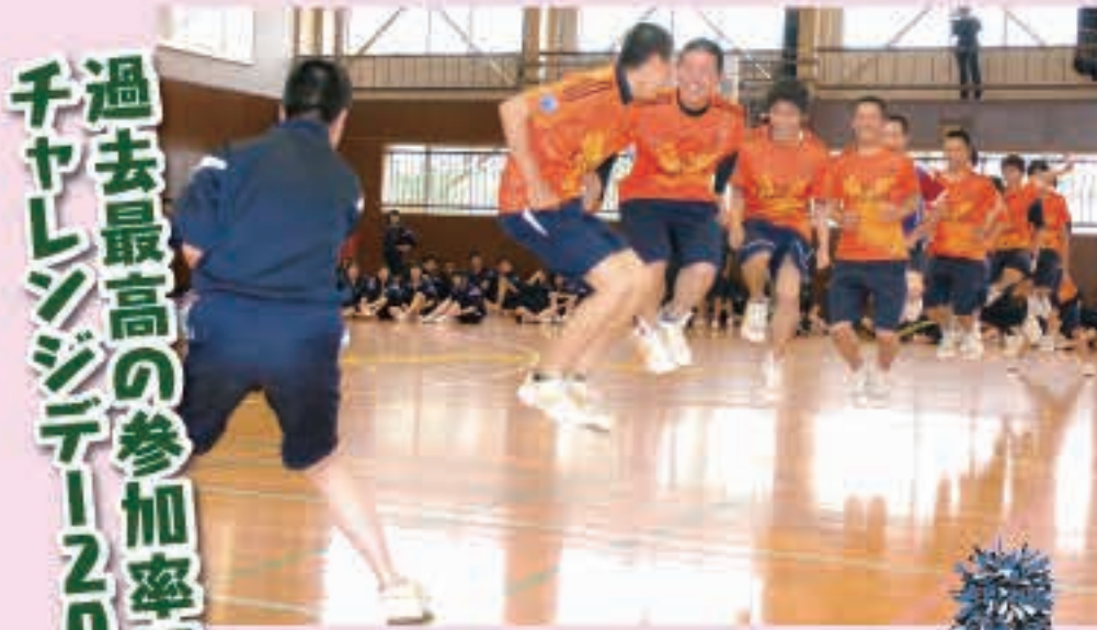
県立五城目高等学校のロープジャンプ