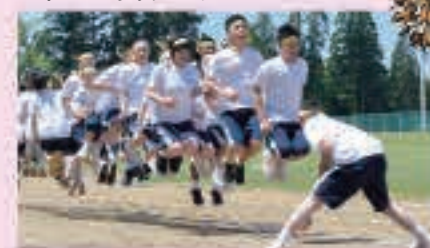
2年生のロープジャンプ