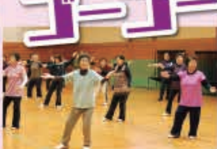
ゆっくり動く太極拳