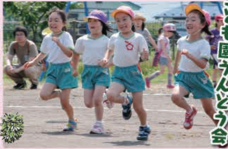
みんな負けるな 仲良くかけっこ