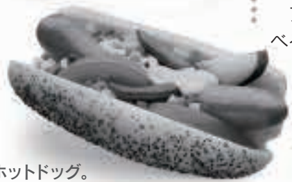
ソーセージをパンに挟んだホットドッグ。チリドッグやシカゴドッグなどのバリエーションがあります。

Some places even have festivals, and there are hotdog eating contests too!