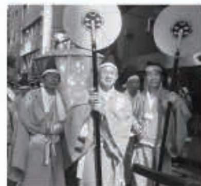
王朝装束に身を包み都心を行進するふるさと五城目会のメンバー

7時30分、日枝神社を出発。強い日差しが照りつけるなか、日本の中枢である皇居、丸の内、霞が関、銀座、日本橋などの地域を巡行しました。ふるさと五城目会員のメンバーは会長以下5人の男性陣が菅笠(かんえい)神具で扇子(かぶ)の一種、菅笠(天皇の頭上に差しかける大きい傘)を担当、4人の女性陣は本年の干支さる山車を担当しました。