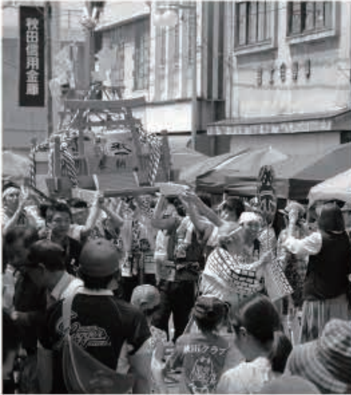
にぎやかな掛け声とともに朝市通りを練り歩くおみこし

6月12日、朝市通りで「市神祭」が開催されました。4月から始めた「ごじょうめ朝市plus+」の開催日に重なったこともあり、山菜や野菜、海産物などのお店のほか、アクセサリーなどの手作り雑貨やお菓子を売るお店など、合わせて87店が出店し、子どもから高齢者まで、約6,000人の買い物客が訪れました。市神祭の協賛イベント恒例の「ミズたたき実演コーナー」や、町食生活改善推進員の皆さんによる「ミズ料理紹介コーナー」には、多くの人が列を作り、旬のミズを味わいました。 また、「おみこし」の練り歩きや上棟式の「餅まき」に加え、朝市ふれあい館前では、土崎湊囃子や五城目天翔太鼓の演奏、空き店舗を利用した「街角芸術展」など、多彩な催しで、楽しい1日となりました。