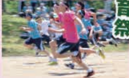
力の限り大地を蹴って男子100m走