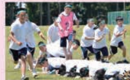
1年生のキャタピラレース