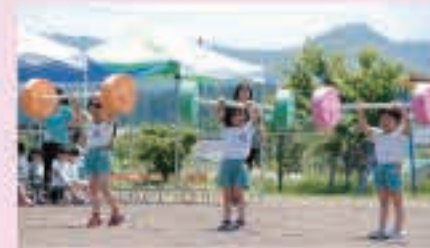
めざせ! リオ・オリンピック