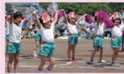
みんなで踊ろう サンバ・カーニバル