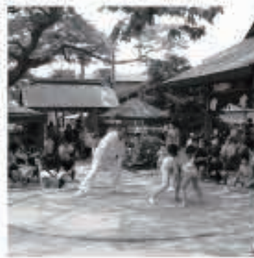
小学生による相撲大会も開催