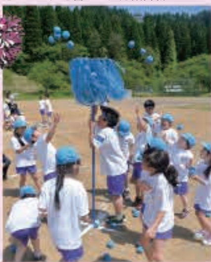
なかなか入らないよ 1年生の玉入れ