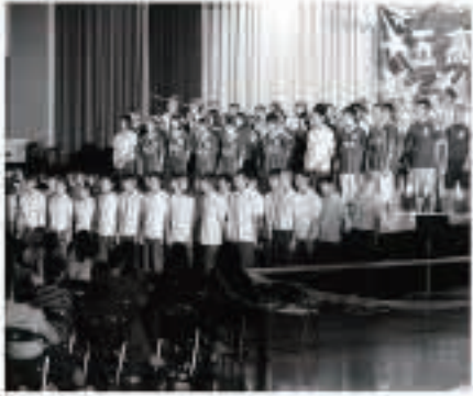
100人を超える1、2年生の大合唱

昔ながらの原風景である「野菜、山菜、だまご鍋」と「さいちご、あげだま、スクールランチ」といった新しい取り組みが奇妙にも入り組み、融合していました。今、五城目の朝には、伝統と変革の化学反応が起きています！