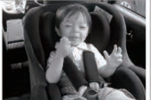
6歳未満の幼児には、チャイルドシートを必ず使用しましょう。6歳を超えても、まだ体の小さな子どもにはチャイルドシートやジュニアシートを使うようにしましょう。

平成27年の調査では、秋田県のシートベルト着用率が運転者99%、助手席94%となっておりますが、後部座席は33%と低い着用率となっております。 シートベルトとチャイルドシートは、交通事故から命を守り、負傷の被害を軽減することから、同乗者全員のシートベルト着用及びチャイルドシート使用を徹底して、大切な「命」を守りましょう。