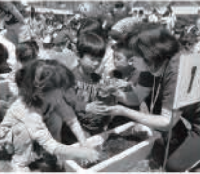
きれいなお花が咲きますように

県立五城目高等学校の学校祭「五高祭」が開催され、6月18日、一般公開されました。生徒一人一人が個性という色を輝かせ、彩り鮮やかな思い出にしようとして「colorful memories」私たちが描く物語」が今年のテーマです。玄関前には、焼き鳥やカレーライ スなどの模擬店が出店し、教室には、クラス新聞やクラス旗などが展示されていました。 ステージ発表では、吹奏楽部や演劇部、「五城目ソーシャルラボ」の発表、合唱、クラス対抗のパフォーマンスなどがあり、多くの来場者を楽しませていました。