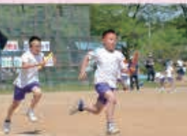
ゴールはすぐそこ色別リレー