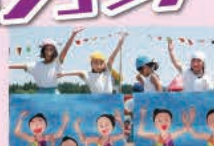
シンクロで ゆうがにポーズ