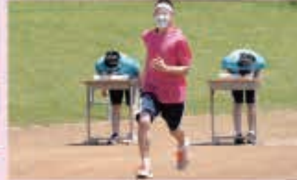
3年生の障害物競走