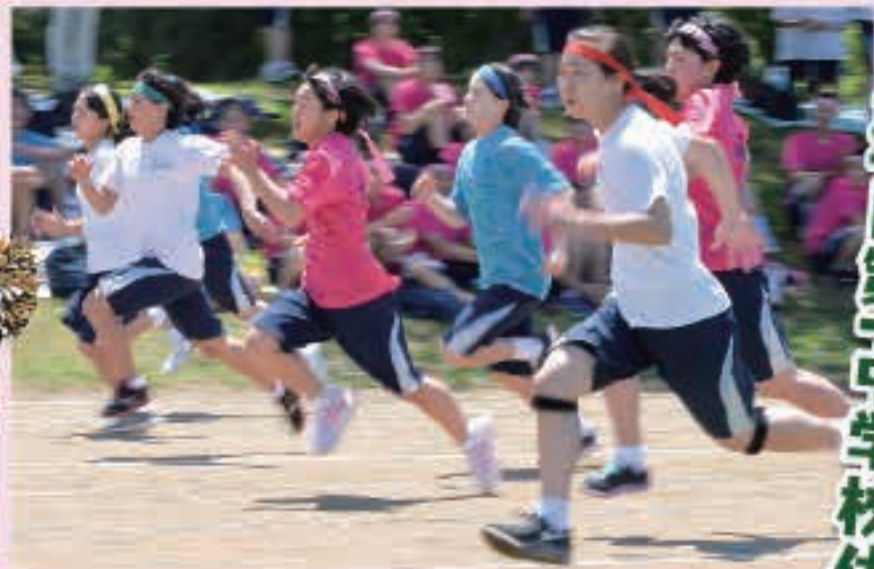
早いぞ! 女子100m走ファイナル