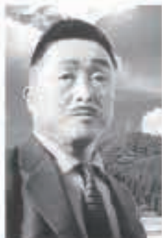
秋田追分創始者 鳥井森鈴