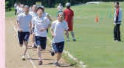
脚自慢がそろう男子1500m走