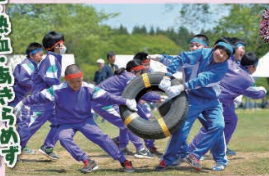
力いっぱい、タイヤの奪い合い負けなぞ