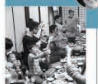
移住者や入居者を迎えるやさやかな歓迎会