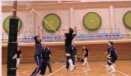
アタックだ! バレーボール