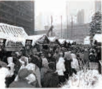
ドイツの食べ物や飲み物が並ぶ、シカゴのクリストキンドル マーケットの様子

The first Chicago Christkindlmarket was held in 1996, and this year it will be held from November 18th - December 24th.