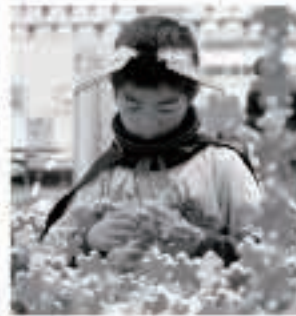
木製のブロックで 作品づくり