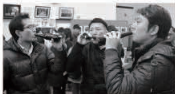
試飲会を開催し、いただいたみんなの感想を反映させ、ついにキイチゴビールが完成

キイチゴはほぼ輸入に頼っていて、輸入品は防腐剤や残留農薬が心配です。それに比べると、町内産のキイチゴは安心感が格段に高く、ニーズもあります。そのような需要にこたえ、キイチゴ栽培農家の収益力を向上させ、生産量も増えていくことを願っています。