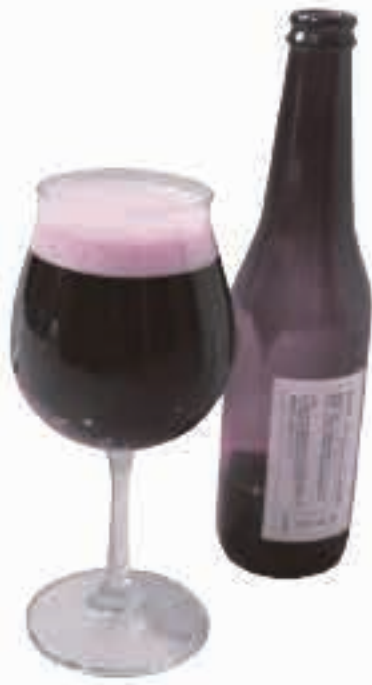
キイチゴビールは年明けに発売予定。価格は1本(330ml)800円(税込)です