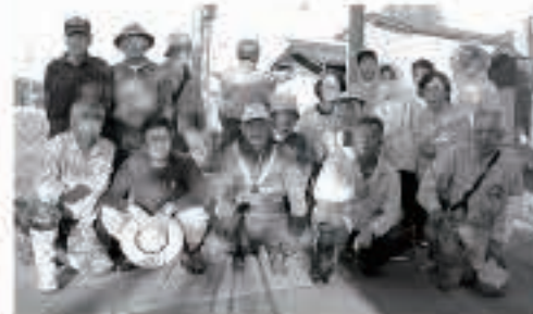
八田長面町内会 8月11日 町道沿線の草刈り、清掃作業