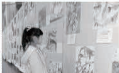
お友達の作品見つけた。児童生徒作品展