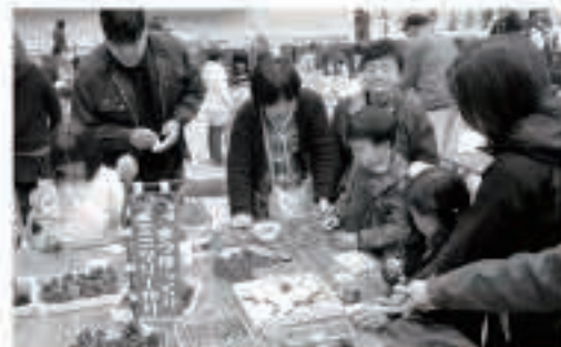
まつぼっくりで自作のツリーづくり