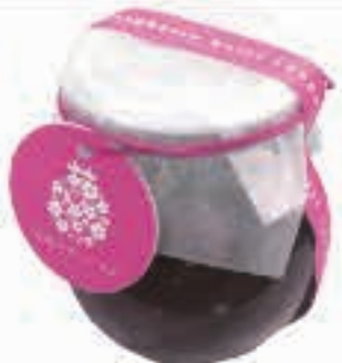
真っ赤な恋地ベリージャム

五城目は、わたしみたいな農家のかあさんの挑戦も受け入れてくれて、実現できるところなんです。