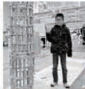
身長よりも高く積んだ 積み木