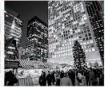
シカゴでクリスト キンドルマーケットが最 初に行われたのは 1996年で、今年 は11月18日から 12月24日まで 開催されます。

クリストキンドルマーケットは、五城目朝市と同 じく、高品質の現地品や食品で有名です。贈り物や 手芸品を買えることはもちろん、ドイツのいろいろな 食べ物、飲み物の試食 や試飲をすることが できます。