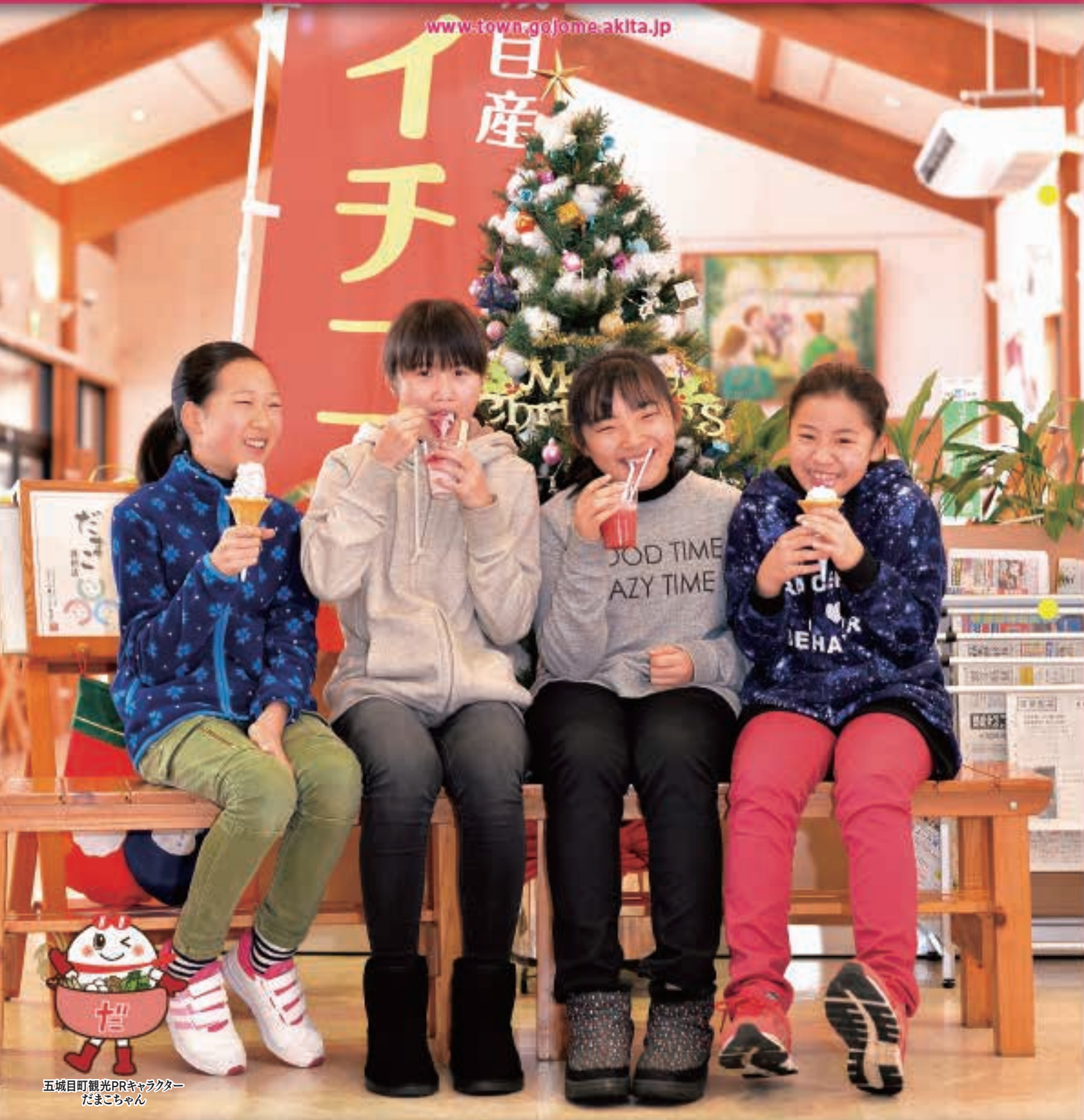
五城目町観光PRキャラクター だまこちゃん