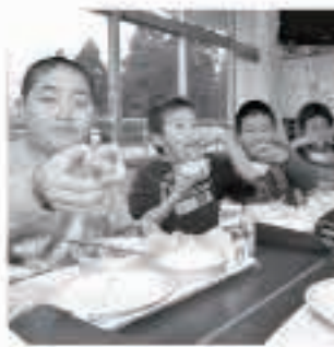
五城目小の給食にキイチゴケーキが登場

また、町内の小・中学校の給食にはキイチゴを使ったケーキやヨーグルトのソースがメニューに加わりました。 今月は、日本一の産地を目指す五城目キイチゴの取り組みを紹介します。