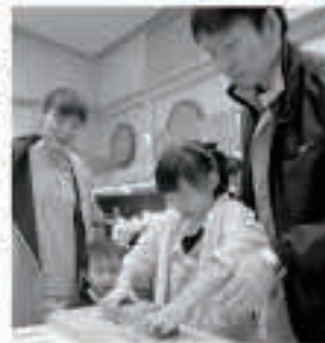
カンナをかけて マイはしづくり