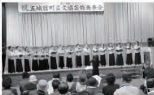
第2体育室では芸文協芸能発表会