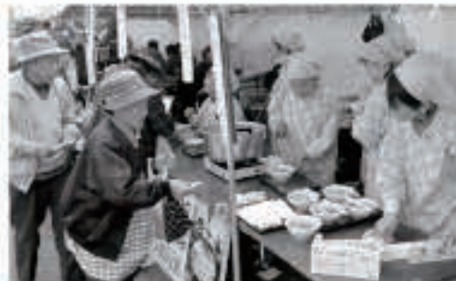
お昼ご飯に人気のだまご鍋