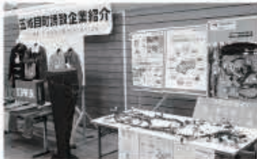
町誘致起業の紹介コーナー