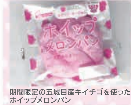
期間限定の五城目産キイチゴを使ったホイップメロンパン

ABS秋田放送の「エビス堂金」とシライシパン(注)が連携し、五城目産キイチゴを使った「ホイップメロンパン」が誕生しました。