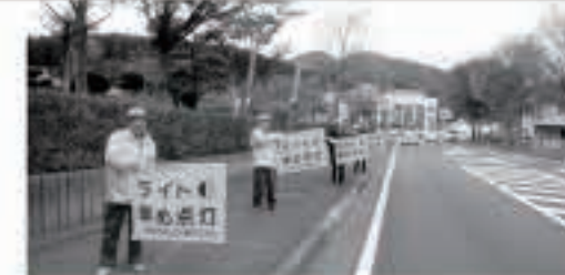
町交通指導隊、町交通安全母の会の協力で、町交通安全協会による「4時からライト」運動を役場前で実施

12月は「飲酒運転追放月間」です。 飲酒運転は、運転手はもちろん、車両提供者、同乗者、また飲酒検知を拒否した場合も刑事罰に問われます。また、自転車の飲酒運転の場合も重い罰則が科せられます。