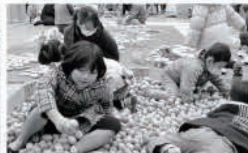
ウッドプールでひと泳ぎ