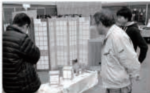
職人の技、組子細工