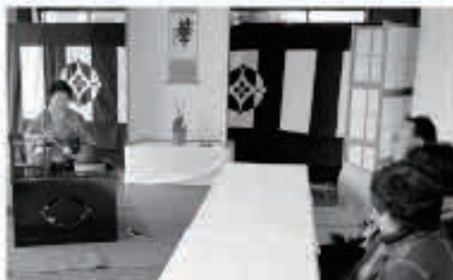
お茶の会でちよつと一服