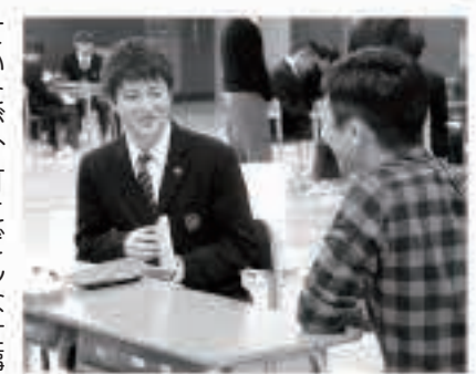
20人の町民に生き方をインタビュー

と悩んだ経験があるのではな いでしょうか。その事を真剣 に考える最初の時期を迎える 五高生を対象に、多様な生き 方や仕事をもつ地域の先輩た ちの生き方に触れてもらうべ く、2年生約100人に、町 民20人の方にインタビューし てもらった授業を行いました。 その名もくおもしろい「ア クティブ・インタビュー」「ネコ バリのつくりかた」！ 地域や、自らの中身ありた い姿に根ざした生き方、働 き方を五城目町の奥地に力強 くたたずむ根古波離岩に例 えて「ネコバリ・キャリア」と 名付けました。 インタビューにのぞんだ高 校生からはこんな感想が届 いています！ 「今まで五城目に暮ら