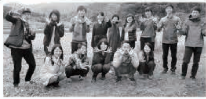
明治大、学芸大、明星大の学生が五城目高の授業に協力

誰しも、自分は何がしたいの だろう？ 自分にはどんな 仕事がある？ 自分にはどんな