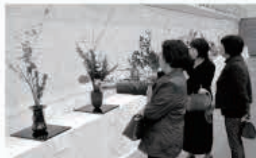
きらりと感性が光る生け花