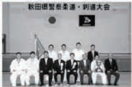
14年ぶり、13回目の優勝の五城目署チームの皆さん