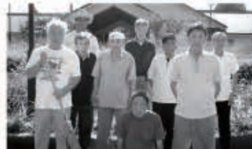
養護老人ホーム森山荘 9月15日 町道沿線の草刈り、清掃作業