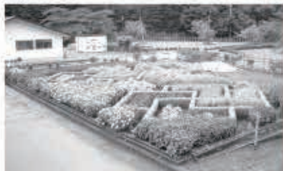
学校・職場団体の部最優秀賞の養護老人ホーム森山荘の花だん