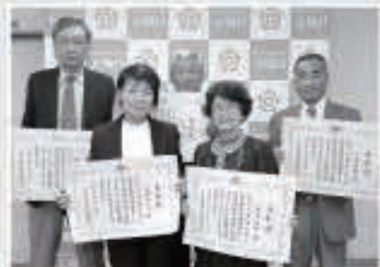
県知事表彰を受けた民政・児童委員の皆さん