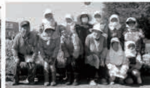
西野老人クラブ 9月21日 であいパーク西野花壇管理業務