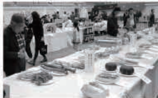
出来秋の成果・立派な野菜などを展示