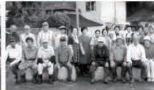
畑町町内会 9月11日 新おせど会館施設周辺の草刈り、清掃作業