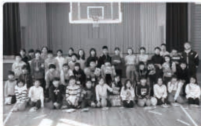
五城目ならではの体験を通じ、友情の輪を広げました