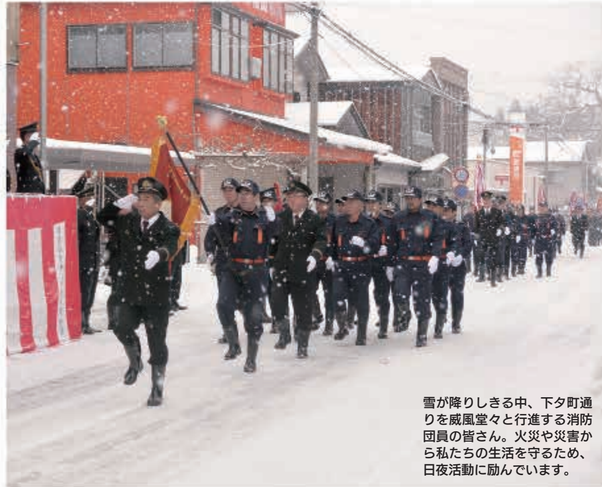
雪が降りしきる中、下夕町通りを威風堂々と行進する消防団員の皆さん。火災や災害から私たちの生活を守るため、日夜活動に励んでいます。

(平成30年1月1日～平成31年1月2日無火災) 第2分団、第4分団、第5分団 第6分団、第7分団、第8分団 第9分団、第10分団、第13分団