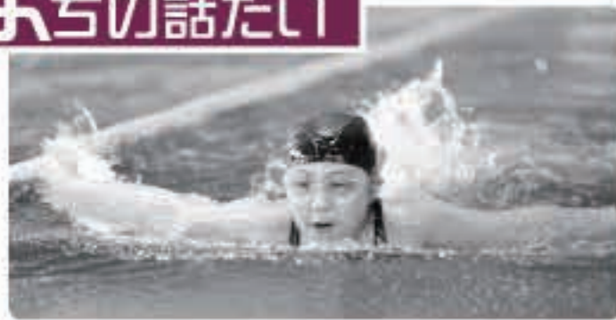
保護者たちの声援を受けながら、力強い泳ぎを披露