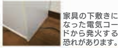
家具の下敷きになった電気コードから発火する恐れがあります。