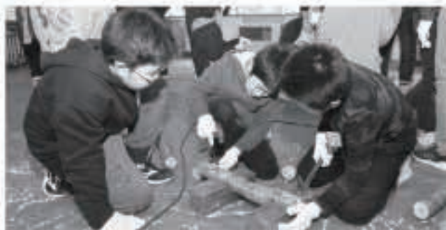
シイタケの菌を植え付けたサクラのほだ木は一人一人にプレゼントされました

児童たちは、「森林のはたらきと手入れ」の説明を受けた後、みんなで協力しながら、サクラのほだ木にシイタケの菌を植え付けました。