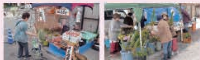
8月は盆の市、12月は歳の市を開催します

通年、日付の下一桁に 2、5、7、0 のつく日の午前7時から正午まで開設します。 そのほか、 5月4日、8月13日、12月31日 には臨時市を開催します。