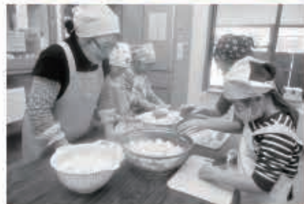
子どもクッキング教室では、カレーライス作りに挑戦