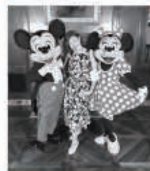
写真はアメリカ大使館での独立記念日パーティにて

胡馬北風。昨年末、壁掛けカレンダーに登場した四字熟語だ。意味は「ふるさとを懐かしむこと。故郷が忘れられないこと」とある。なんだか他人事には思えなくて、今でも見える所に置いたまま。五城目を離れてもうじき35年になるが、職業人としての体裁は整っていても、家に帰れば猫を相手に「ごじよめのごじよめ」で話す毎日、全くとって都会人には程遠い。それどころか、五感や忍耐力など、自分を構成している全てが「メイド・イン・五城目(五城目製)」のままだから、寧ろそんな自分が誇らしくさえ思う。小学生時代、友人らと一緒に給食に出た半切りの八朔を食べずにとっておき、放課後、グラウンドの裏から高台に登って、町を見下ろし一房ずつ頬張る。酸っぱさで顔がくしゃくしゃになりながら、夢を語りつ。時には町に向かかって叫んでみる。頬にあたる風が清々しい。私の原点はずっとそこにあると思ってる。何でも乗り越えられそうな気がするのだ。