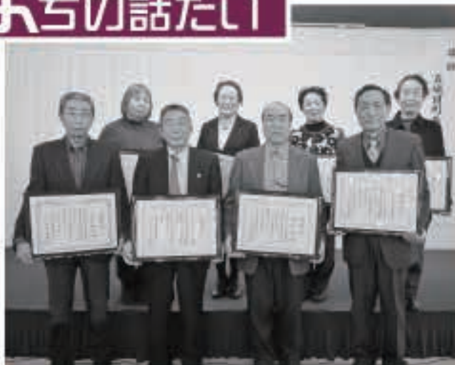
長年の活動に功績のあった皆さんに、表彰状が贈られました