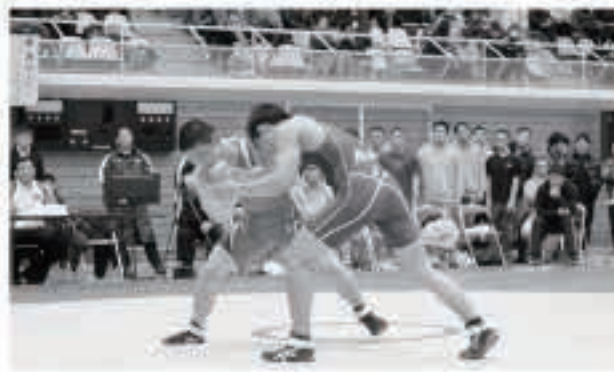
秋田商業高校の選手として大会に出場し、地元の声援を受けながら試合に臨む□□□□さん◎(同校1年・□□□□)

学校対抗戦では、八戸学院光星高校（青森県）が11年ぶり11回目の優勝を飾りました。