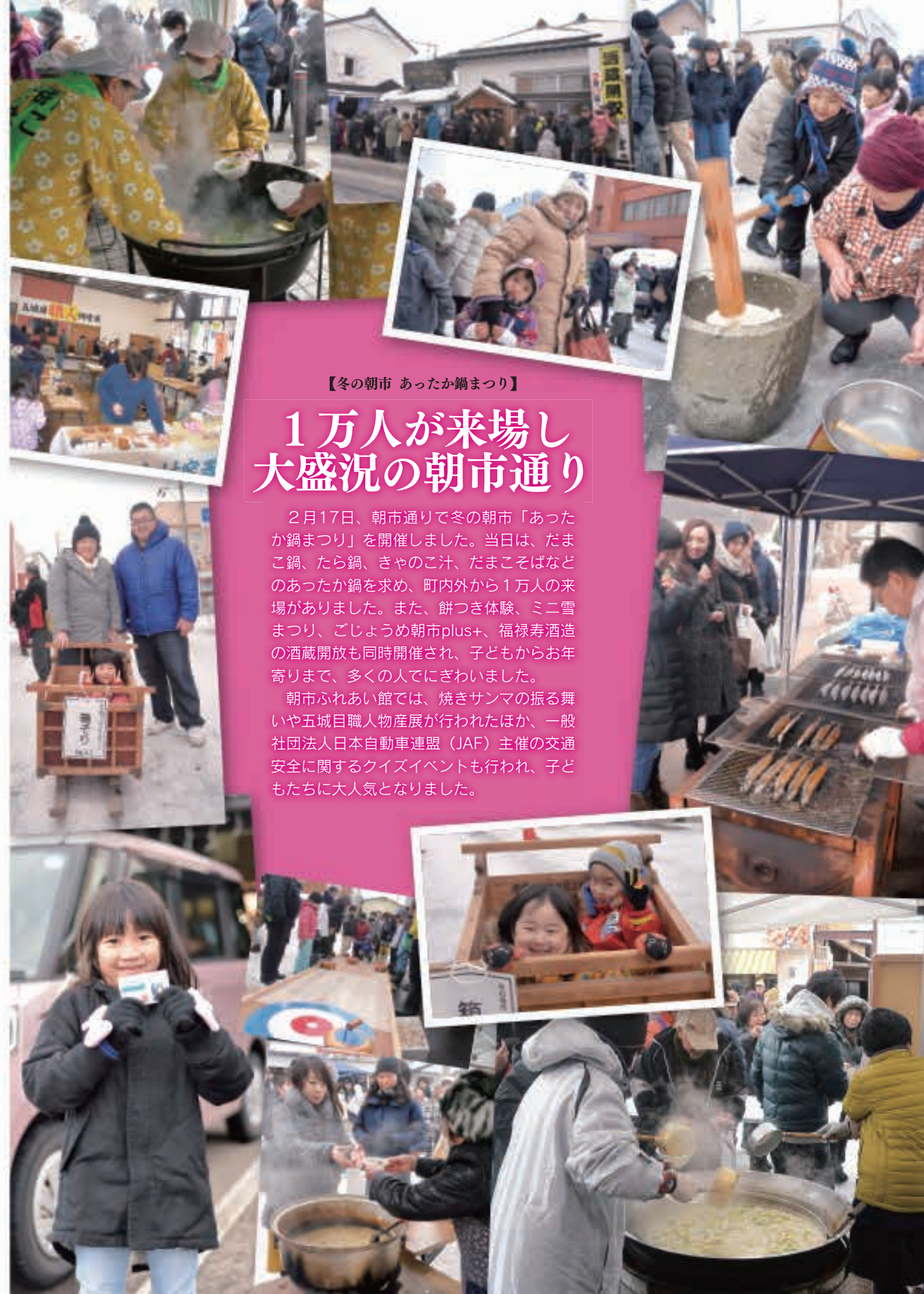
【冬の朝市 あったか鍋まつり】