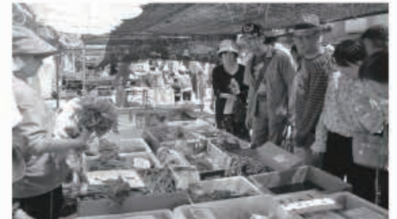
旬の山菜を求めて、町内外から多くの方が来場しました。

もれなく山菜が当たる抽選コーナーや、だまこそば、山菜汁、だまこ鍋などのお店には行列ができ、朝市通りは町内外から訪れた6,500人でにぎわいました。