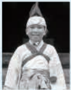
〇〇 〇〇さん (五城目小4年)

教室では、先生たちが丁寧に教えてくれるので楽しい。競演会では、たくさんのお客さんの前でうまくできました。来年もがんばります。