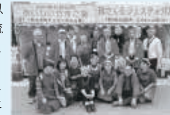
さくらフェスへの出店(H27.3靖国神社)

姉妹提携を締結した平成元年の11月、首都圏に在住する五城目町出身者で構成する「ふるさと五城目会」が設立されました。以来、千代田区との交流事業に大きく関わり、毎年行われている「さくらフェス」への出店など、首都圏での町のPRに多大なご貢献をいただいています。