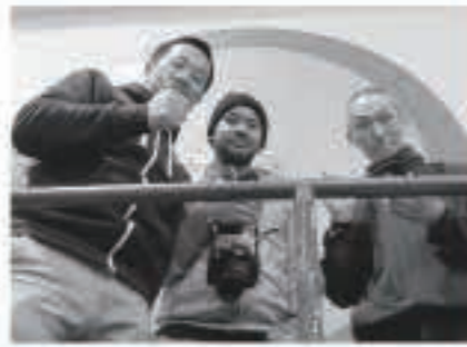
連休前には、広域五城目体育館で中学校の春季大会を観戦しました。

先月は五城目のお祭りを楽しみました。五城目神明社で行われた番楽競演会では、日本の伝統舞踊を初めて見て、とても感銘を受け