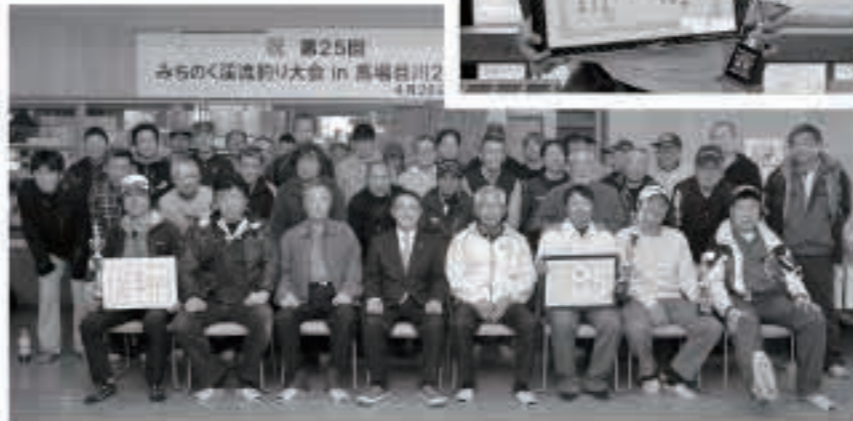
25回目となった今大会には、県内外から40人が参加しました