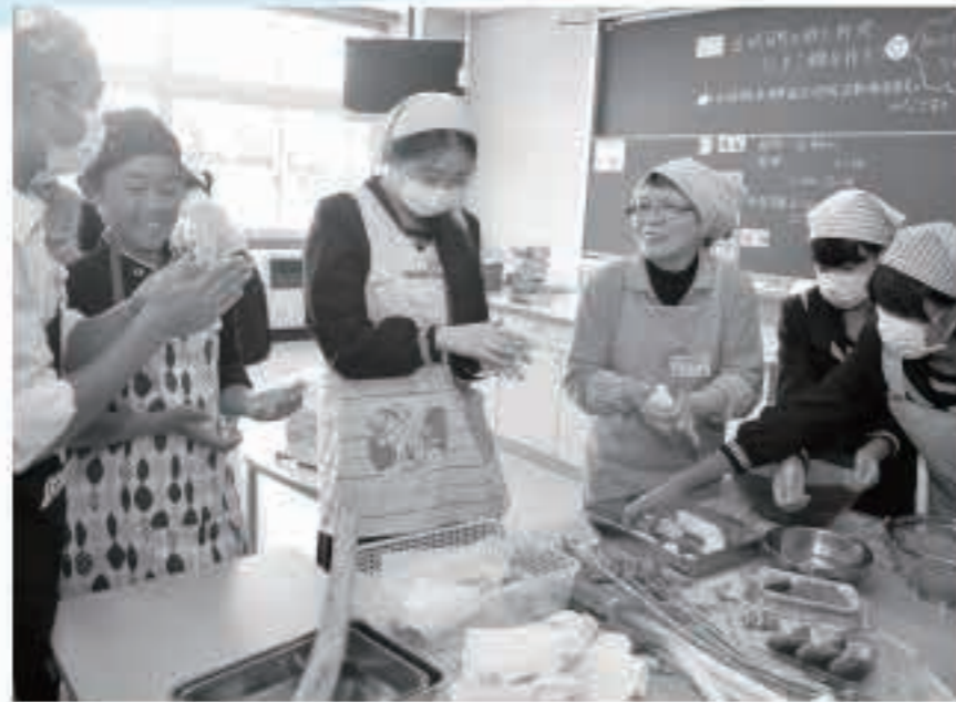
だまご鍋作りを通じて、郷土への愛着も育まれています。