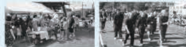
各種イベントでの交流(H27.8 千代田区プールの開館式) 双方の体育大会への参加(H26.10 区民体育大会)

そして、平成元年10月26日に姉妹提携が締結され、以来、児童交流、スポーツ交流、各種イベントなどでの交流、さらには災害時の協力体制の整備など、幅広い交流が図られています。