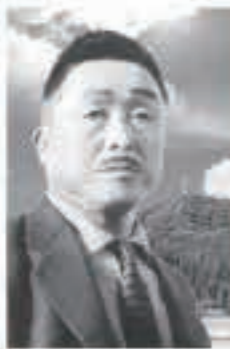
秋田追分創始者 鳥井森鈴翁