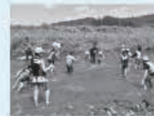
児童双方向交流(H29.8五城目町馬場目)