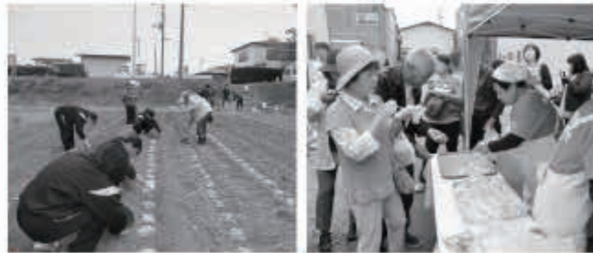
「学校の畑」では、5月9日に、ジャガイモの種芋を植えました。市神祭では、旬の山菜「ミズ」を使った料理のレシピなどが紹介されています。