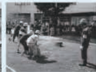
双方の防災訓練への参加(H26.9千代田区総合防災訓練)