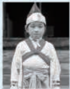
〇〇 〇〇さん (五城目小4年)

初めての競演会はお客さんがたくさんいて緊張したけど、今までで一番うまくできました。番楽はいろいろな動きがあって楽しいです。