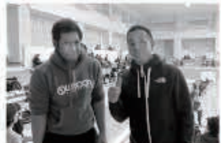
11月2日には、五一中生が出場したバスケットボールの試合(U15ユース育成強化大会)を観戦しました。

私の地域では、キャンディをあげないと子どもたちが家にいたずらをするかもしれません。