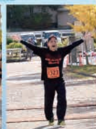
最後は笑顔でゴール!