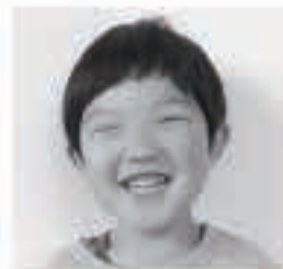
□□ □□くん (大川)