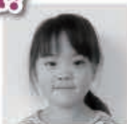
□□ □□ちゃん (久保)