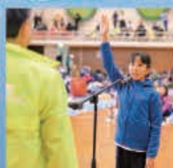
ふるさとあきたランに出場した□□□さんが選手賞(五城目小6年・新町)