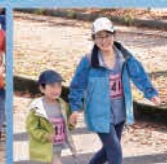
手を繋いで親子で一緒にウォーキング