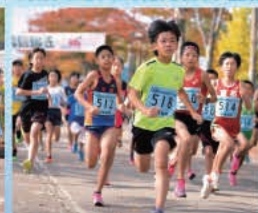
思い強くスタートした3kmの部