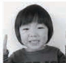
□□ □□ちゃん (矢場崎)