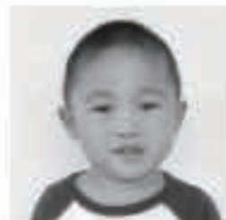
□□ □□くん (雀籠)