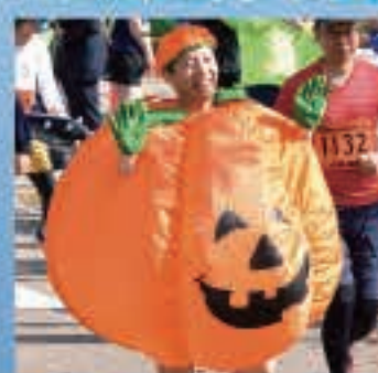
ハロウィーンの仮装が大会を彩ります