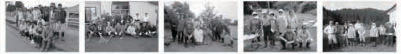
「希望ヶ丘町内会」町道沿線の草刈り、清掃作業 「広ヶ野町内会」町道沿線の草刈り、清掃作業 「町グラウンドゴルフ協会」広場の草刈り、清掃作業 「小野台町内会」町道沿線の草刈り、花壇整備 「平ノ下町内会」町道沿線の草刈り、清掃作業

地域の道路や公園など、公共施設の維持管理活動を地域の皆さんから作業していただく場合、必要経費(消耗品、燃料、原材料、借上料など)を町が負担します。