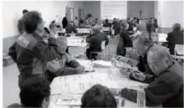
自主防災組織と消防団員同士での情報交換も行われ、相互の関係強化が図られました。

研修では、本町でここ数年多く発生している風水害に焦点をあて、住宅地図を活用し、「災害図上訓練D1G（風水害版）」を行いました。参加者は、それぞれの地区の危険箇所をあらためて確認し、水害発生時の避難行動にかかる共通認識と自主防災組織として今後必要な体制整備の確認をしました。