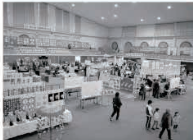
広域五城目体育館と町民センターを会場に開催した産業文化祭には、2日間で約4,600人の来場がありました