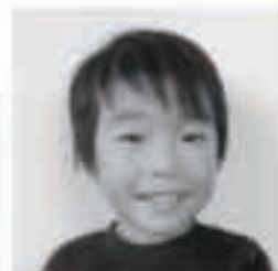
□□□ □くん (岡本一区)