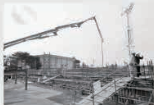
左から伸びているのはコンクリートポンプ車。型枠内にコンクリートを圧送します。

五城目小学校改築工事は、杭工事を終えて、約15層の鋼管杭約230本が地中に打ち込まれていきます。その工程では、杭を地中に回し入れながらセメントミルクを注入し、支持力を高める「アットコラム工法」が採用されています。その後、地中部分の基礎鉄筋を