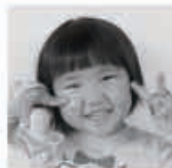
□□ □□ちゃん (今町)