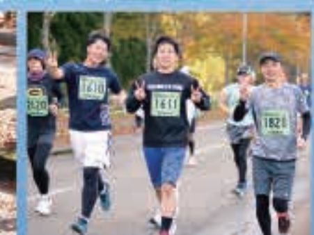
さわやかな表情で駆け抜けたランナーの皆さん