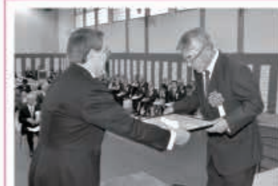
農村いきいき大賞を受賞した下樋口みらい共生会