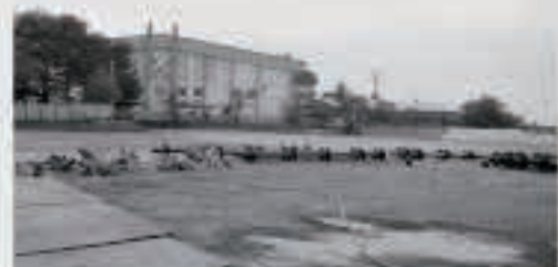
横置きにしている鋼管杭。2本をつなげて打ち込みます。