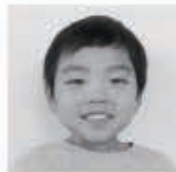
□□ □□くん (築地町)