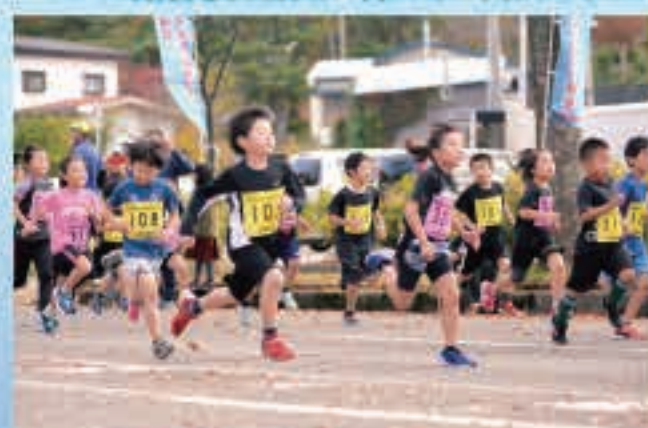
2kmの部には小学1~4年生が出場