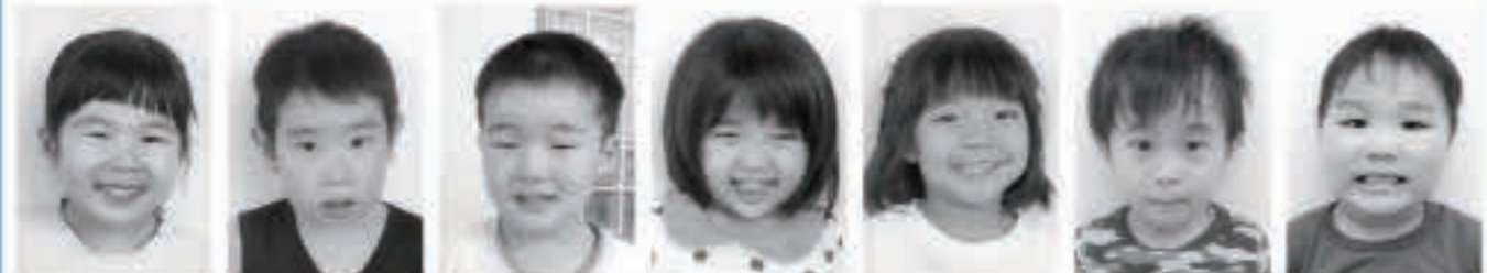
□□ □□ちゃん (米沢町) □□ □□くん (新畑町) □□ □□くん (紀久栄町) □□ □□ちゃん (下樋口) □□ □□ちゃん (雀籠) □□ □□くん (曙町) □□ □□くん (富田)

この時期に乳歯の歯列はほぼ完成するので、家族みんなで協力しあい、正しい歯の健康維持について基本を身につけましょう。