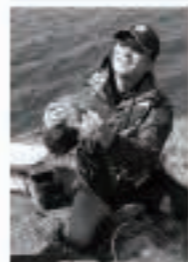
秋田ケーブルテレビ「私立釣竿学園 爆釣クラブ」で男鹿のクロダイを釣り上げました!

私は、五城目町が大好きです。きれいな川、山、空、人。もともと町がイキイキしてほしい。人がイキイキしてほしい。そうなるように、みんなで考えていければなと思います。いつまでも大好きな五城目町が在り続けるために一緒に頑張りましょう!