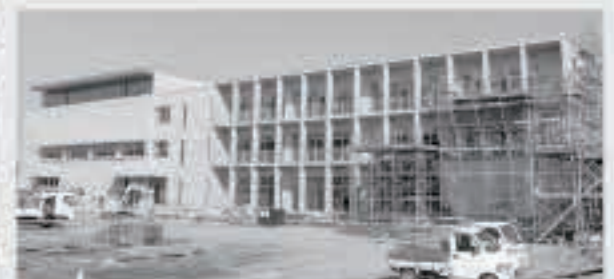
グラウンド側からの様子。足場が外され、教室の様子が見えてきました(左側が体育館、右側が普通教室)。