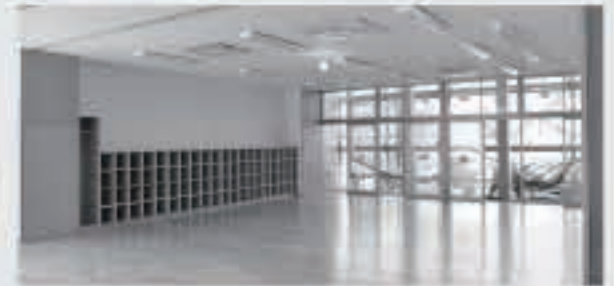
1階は、フローリング・家具の工事が進んでいます。