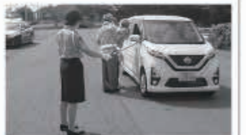
8月2日(日)夏の交通安全キャンペーンの様子。

秋の全国交通安全運動がスタートします。夕暮れが早くなってこの時期、歩行者や自転車の見落としによる事故が増える時期でもあります。ドライバーの皆さんはもちろん、歩行者や自転車利用者も反射材を身につけるなど、交通事故防止に努めましょう。