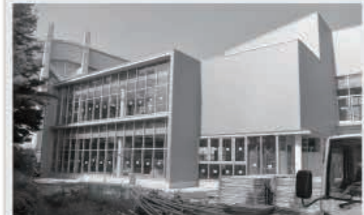
地域図書室が入るメディアセンター。外部の工事は完了しています。