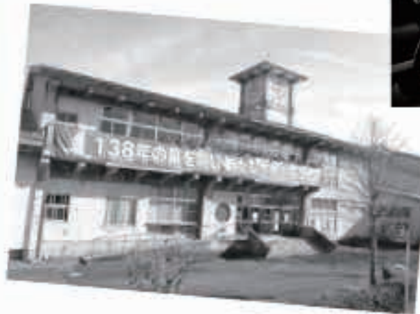
【平成27年3月31日】 大川小が閉校。138年の歴史に幕。4月1日からは五城目小と統合。