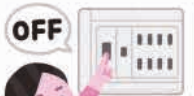
通電火災を防ぐため、停電時に避難の際はブレーカーを切りましょう。

通電火災とは、停電が復旧した際に起こる火災で、電気コンロ、観賞魚用ヒーターなど熱を発生する器具が、機器の転倒・落下・損壊などにより可燃物と接触する状況となり、火災に至るケースです。 通電火災を防ぐためには、電化製品のスイッチを切る、電源プラグをコンセントから抜く、避難するときにブレーカーを切るようにしましょう。