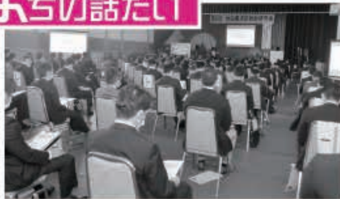
県内消防本部の救助隊員が出席し、救助体制の充実を図るため、意見や情報を交換しました。