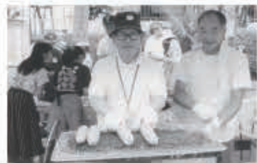
ふるさと五城目会として、麴町小学校納涼子ども会に参加(写真中央が私です)。

数年後、年に一、二度帰るようになり、母親が迎えに来てくれた。歩く姿は、初老の姿になっていたが、口だけは達者だった。僕が帰省すると、またいつ帰ってくるかと尋ね、自分の年老いたことはさておき、体に気をつけるように言う。やはり母親だと思ふ。