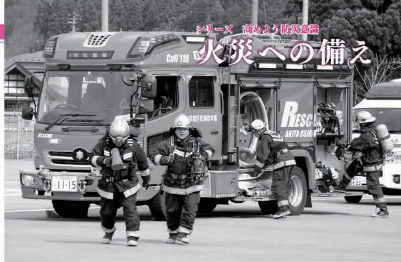
町消防本部では火災防犯訓練などを実施し、町民の安心安全な暮らしを守るため、日夜活動にあたっています。