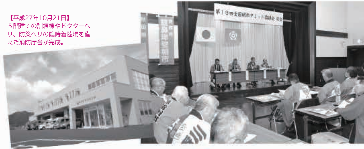
【平成27年10月21日】 5階建ての訓練棟やドクターヘリ、防災ヘリの臨時着陸場を備えた消防庁舎が完成。