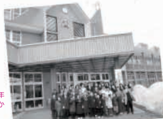
【平成25年3月31日】 馬場目小が閉校。138年の歴史に幕。4月1日からは五城目小と統合。