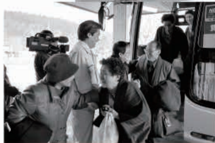
【平成23年3月13日】 旅行で岩手県大槌町を訪れていた町老人クラブ員36人は、宿泊先で被災するも、地元の方から避難場所などの提供を受け、全員無事帰町。