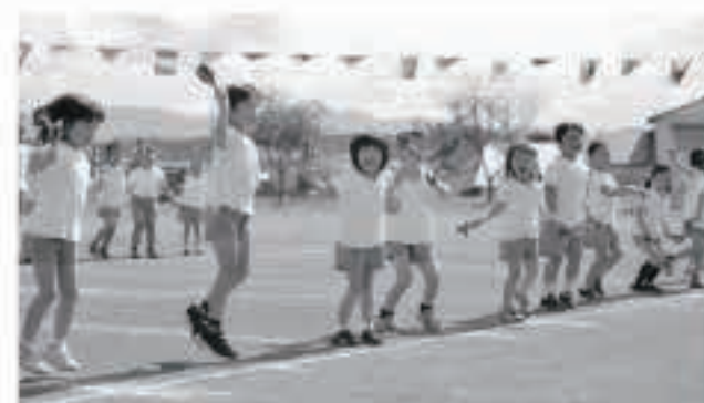
「千本桜」の曲に合わせて、練習を重ねてきた踊りを元気いっぱいに披露しました。

本年度の運動会は、新型コロナウイルス感染症対策として、3歳児、4歳児、5歳児とそれぞれ日程を分けて開催。5歳児たちは、練習を重ねてきた各種目に取り組み、保護者と園職員が見守る中、元気いっぱいに園庭を駆け抜けました。