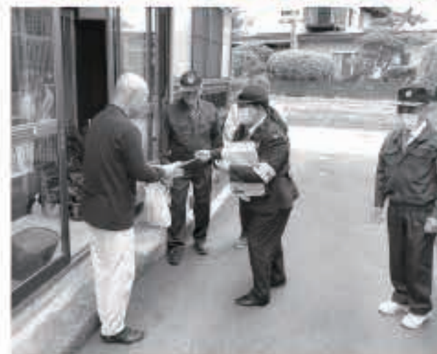
10月9日に、西野町内で家屋の防犯診断を実施しました。