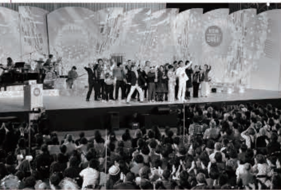
【平成27年10月18日】 町制施行60周年を記念し、広域五城目体育館で「NHKのど自慢」を開催。

昭和30年（1955年）に旧五城目町、馬場目村、富津内村、内川村、大川村の1町4村が合併し、新生五城目町として発足してから本年で65年を迎えました。 今月号では、その65年のうち、最近10年間の町の歩みを、写真や主なできごとともに振り返っていきます。