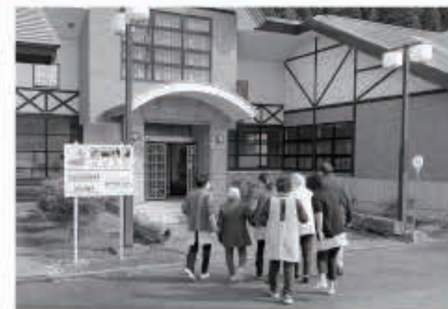
施設の入所者と職員が、町の指定避難場所の富津内地区公民館に避難するまでの手順などを確認しました。

町からは施設へ事前連絡をし、登録制メールや町ホームページなどで訓練情報を入力・発信しました。