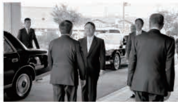
【平成24年10月30日】 秋田県をご訪問されていた皇太子さま（現天皇陛下）が本町を初訪問。