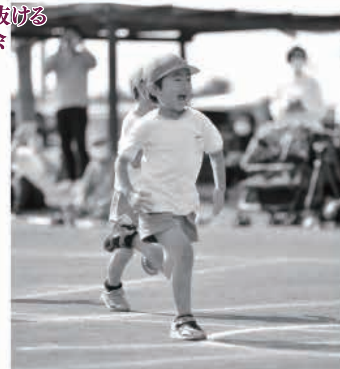
かけっこでは、30秒先のゴールを目指し、園庭を駆け抜けました。