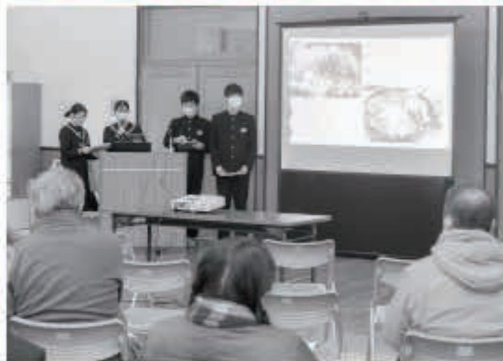
生徒たちは、今までの調査や取材などを基に、それぞれが思い描く町の未来を実現させるための取り組みなどを発表しました。

生徒たちからは、「様々な手段を用いて町の特産品などを広く発信することで、より多くの人に町の魅力を伝えられる」「町の食文化や伝統工芸品を生かし、たくさんの方が町を訪れるような取り組みを」などの意見がありました。