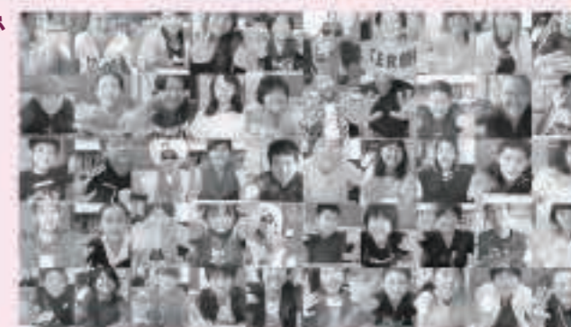
今回の作品のひとコマ。五城目小6年生全員で五城目朝市の魅力を伝えました。

※CMの放映日時は、毎月の町広報の「町民カレンダー」に掲載します(1月放映分は23頁に掲載)。