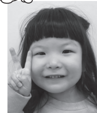
□ □ □ □ちゃん(上田町)