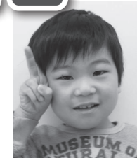
□ □ □ □くん(新畑町)