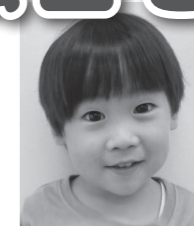
□ □ □ □くん(樋 口)

『三つ子の魂百まで・・・』といわれますが、3歳は心身の発達上、節目となり極めて重要です。この時期に乳歯の歯列はほぼ完成するので、家族みんなで協力しあい、正しい歯の健康維持について基本を身につけましょう。