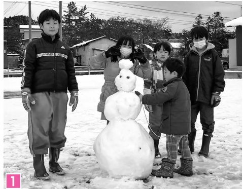
1 教育留学事業で首都圏から小学生とその家族が来町し、五城目小での学校生活や課外活動を体験。2 12月9日に、町教育委員会、一般社団法人ドチャベンジャーズ、合同会社ゆあみ、株式会社アドレスの4者間で、教育留学事業の課外活動や、町での暮らしに関する情報提供などを目的に相互連携協定を締結しました。

森山無線中継施設用道路の擁壁倒壊箇所は、通信事業者から仮復旧工事を行う旨の説明があり、9月上旬から着手し、10月11日に現地に入り、倒壊した擁壁の除去と土留めの設置を実施しております。仮復旧後も管理道には落石による危険箇所が多数あることから、既存のバリケードに替え、さらに安全を確保するため、立入禁止の門扉を設置する旨、通信事業者から伺っ