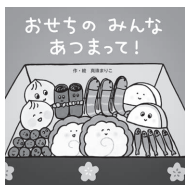
「おせちのみんなあつまって!」 真珠まりこ / ひさかたチャイルド