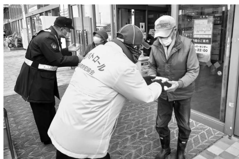
町防犯協会、町防犯指導隊と五城目警察署の皆さんが合同で、特殊詐欺被害防止などを呼びかけました。

年始の時期は犯罪や事故などが増加する傾向にあります。今一度気を引き締め、犯罪被害に遭わないように過ごしましょう。