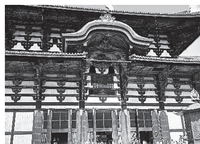
見る人を圧倒するような東大寺大仏殿