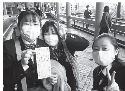
仲良し3人組(清水寺にて)