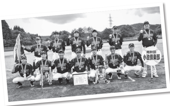
【10月8日】 こまさくらぶ 全県おはよう野球大会で小政倶楽部が初優勝。