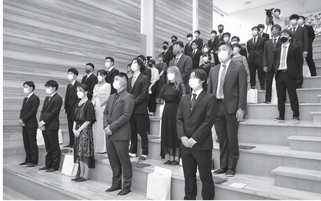
【8月15日】 はたち 初となる「二十歳のつどい」を、五城目小学校階段教室で開催。

昨年、広報「ごじょうめ」では様々な町のできごとをお伝えしてきました。今月号ではその主なものを抜粋して紹介し、写真とともに町の2022年を振り返ります。