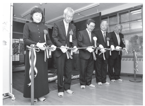
【4月22日】「映画『釣りキチ三平』メモリアルルーム」が杉沢交流センター友愛館内にオープン。