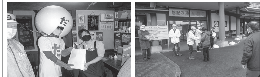
町交通安全協会では、12月2日に飲食店巡回訪問を、12月11日に年末の交通安全キャンペーンを、町交通指導隊、町交通安全母の会、五城目警察署の協力で行いました。

「ぼくたちの暮らしのそばに110番」 1月10日(火)は「110番の日」 緊急時以外の相談・連絡などには、警察相談専用電話(☎864・9110 または#9110)をご活用ください。