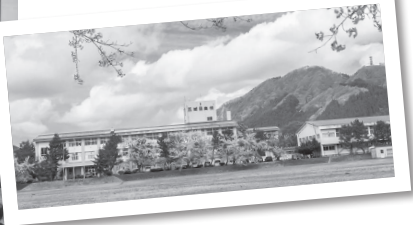
【10月15日】五城目高校創立80周年記念式典が開催。