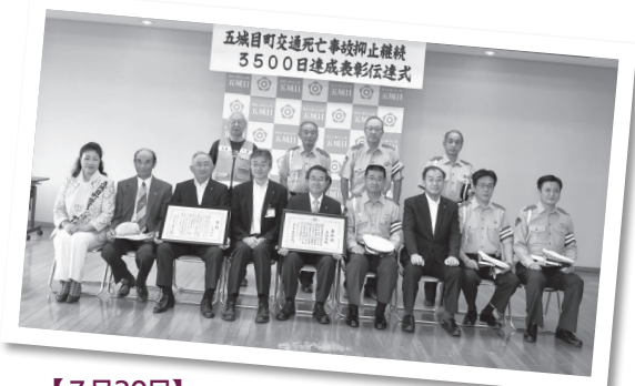
【7月20日】6月16日に交通死亡事故ゼロ3、500日を達成し、県知事から表彰状、県警察本部長から顕彰状が授与。