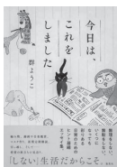
「今日、これをしました」 群ようこ / 集英社