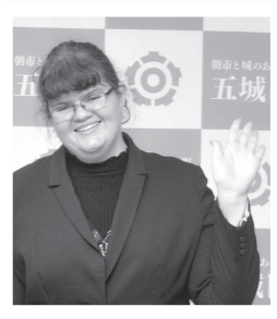
【8月1日】ALTのケリーさんが任期を満了し退任。