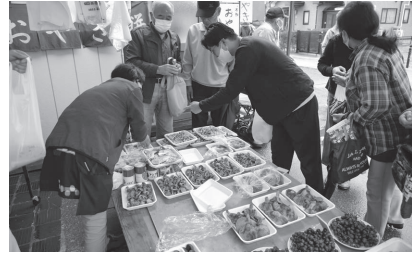
【10月22日】3年ぶりとなる秋の朝市「きのこまつり」を開催。