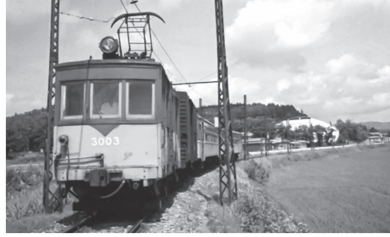
【4月21日】地域の足として生活を支える秋田中央交通株式会社が開業100周年を迎える(写真は約半世紀にわたって運行した五城目軌道)。