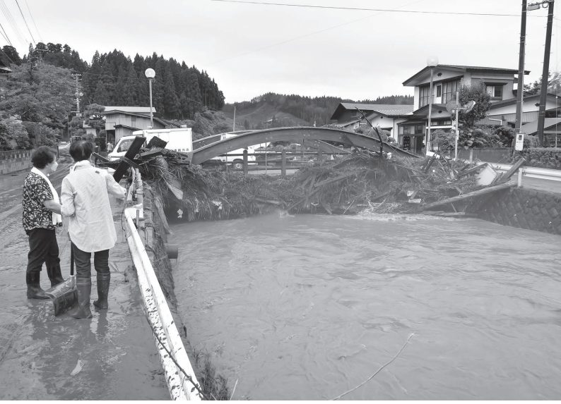
【8月12日～13日】記録的な豪雨により、内川川、富津内川の2河川が氾濫するなど、町内各地で大きな被害(写真は湯ノ又町内)。