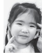
〇〇〇〇〇〇ちゃん (畑 町)