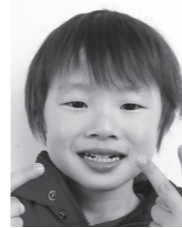
〇〇 〇〇くん (西 野)