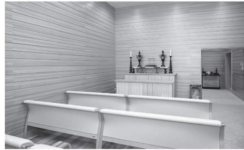
令和3年度に着手した町火葬場の大規模改修工事が完了。