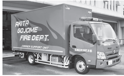
水難事故や林野火災などの緊急時に用いる資機材搬送車を1台購入。