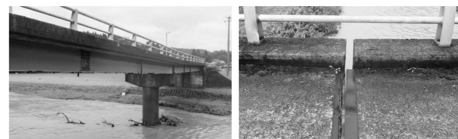
(注) 応急組立橋 災害などにより緊急的に橋が必要となった時に架設する仮橋。今回貸与を受けたのは、「下路式ワーレントラス橋」で、橋長40m、車道幅員4m。