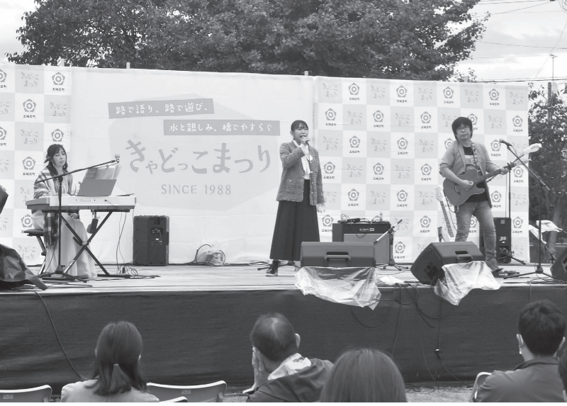
【10月15日】4年ぶりに「きゃどっこまつり」が開催。