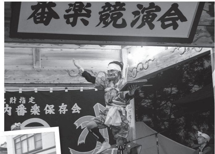
【5月20日】五城目神社神楽殿で4年ぶり51回目となる番楽競演会を開催。