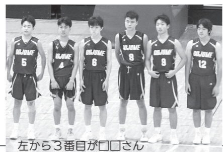
左から3番目が□□さん

1月には県内の高校が集まる強化試合を控えており、□□さんは「冬期間は練習時間があまり確保できないため、自分たちのプレースタイルを崩さず、万全の体制で臨みたい」と話しました。