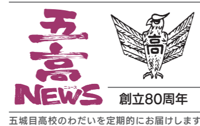
五城目高校のわだいを定期的にお届けします!

さて、今年は十二支のなかで唯一「目には見えない生物」の辰年です。雄大に流れる川や、激しいしぶきを上げる滝、美しい雲の動きを見ていると、なんだか「辰」とはそんな自然の力の動きのようなものことかな？と思うことがあります。皆さまにとっても、何気ない日々が、大切な人たちの愛おしい時間でありますように。