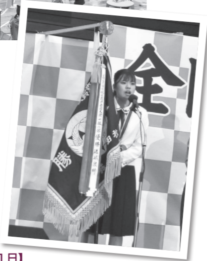
【10月1日】4年ぶりに入場制限を設けずに「秋田追分全国大会」が開催。