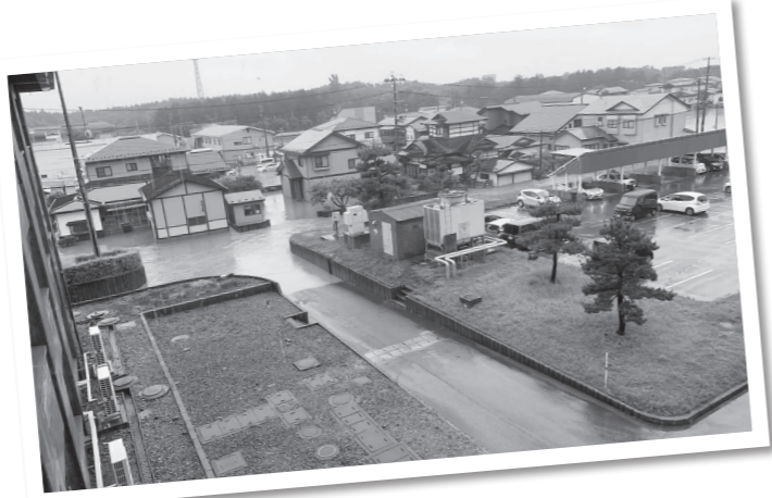
【7月14日～15日】断続的に降り続いた雨により、町内の河川が氾濫。各地で大規模な浸水被害が発生(写真は西磯ノ目地区)。