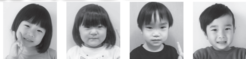
□□ □□ちゃん (畑 町) □□ □□くん (岩城町) □□ □□くん (雀 籠) □□ □□くん (東磯ノ目)

▶11月9日健診 『三つ子の魂百まで・・・』といわれますが、3歳は心身の発達上、節目となり極めて重要です。 この時期に乳歯の歯列はほぼ完成するので、家族みんなで協力しあい、正しい歯の健康維持について基本を身につけましょう。