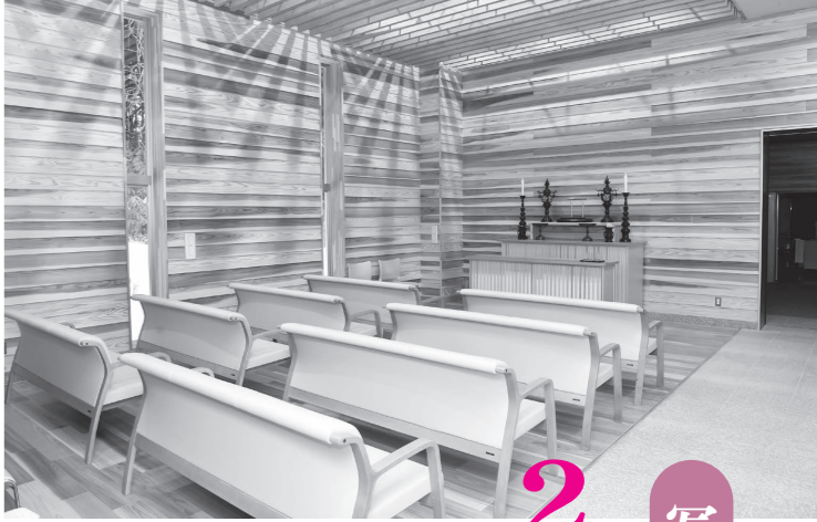
【2月1日】町火葬場の大規模改修工事が完了し、全面供用開始。

昨年、広報「ごじょうめ」では様々な町のできごとをお伝えしてきました。今月号ではその主なものを抜粋して紹介し、写真とともに町の2023年を振り返ります。