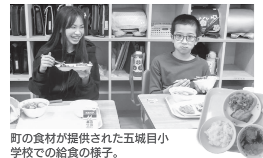
町の食材が提供された五城目小学校での給食の様子。

五城目小学校では、のりあえ・じゃがいものそぼろ煮に、五城目第一中学校では、じゃがいもの炒め・小松菜と大根の味噌汁にそれぞれ五城目産の食材が使用されたほか、ご飯にも五城目産のお米が使われました。町の学校給食では、日常的に地場産の食材を取り入れることで、地産地消の取り組みがなされています。