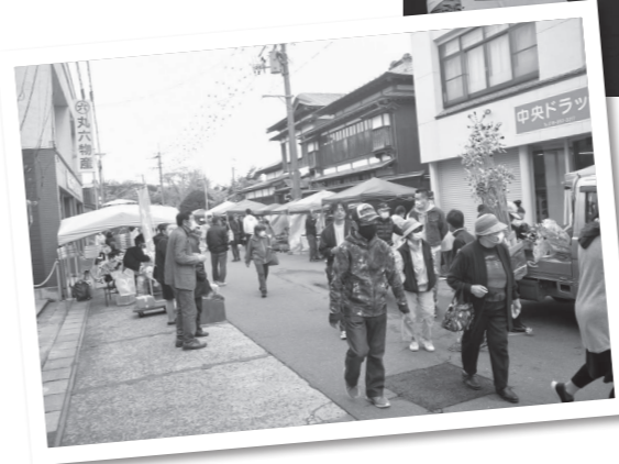
【5月7日】春の朝市「山菜まつり」が4年ぶりに開催。