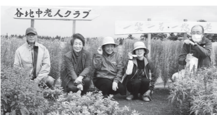
最優秀賞の谷地中老人クラブ