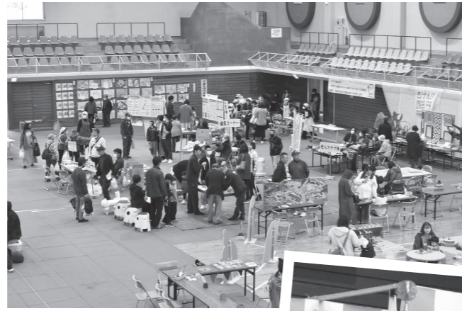
【10月28日】4年ぶりに「町産業文化祭」を開催。