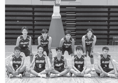
「高体連中央支部バスケットボール新人大会」に出場したバスケットボール部と野球部（後列4名）