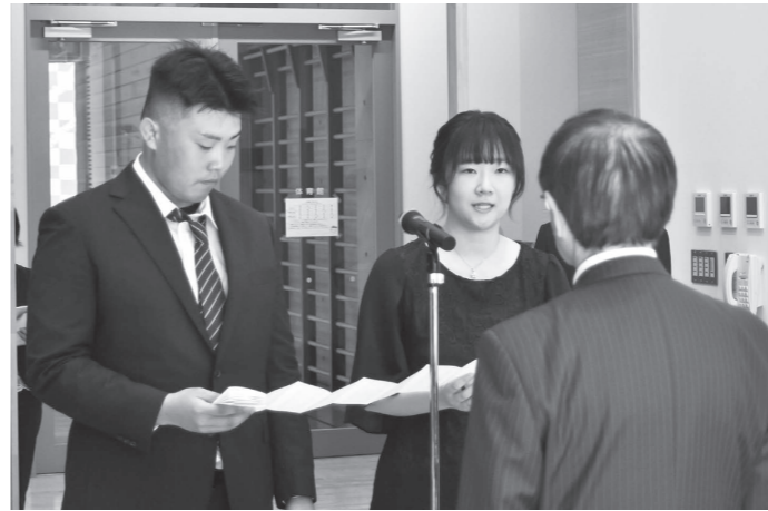
【8月15日】五城目小学校階段教室で二十歳のつどいが開催。