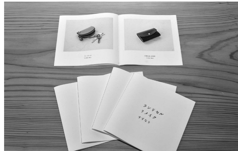
県内の各施設に設置する、ランドセルリメイクの商品(財布やペンケース)カタログの制作に活用。

令和5年度に、町の補助金を活用して新商品の開発や商品の宣伝、店舗の改修などに取り組んだ町内のお店・事業所を4件ご紹介します。