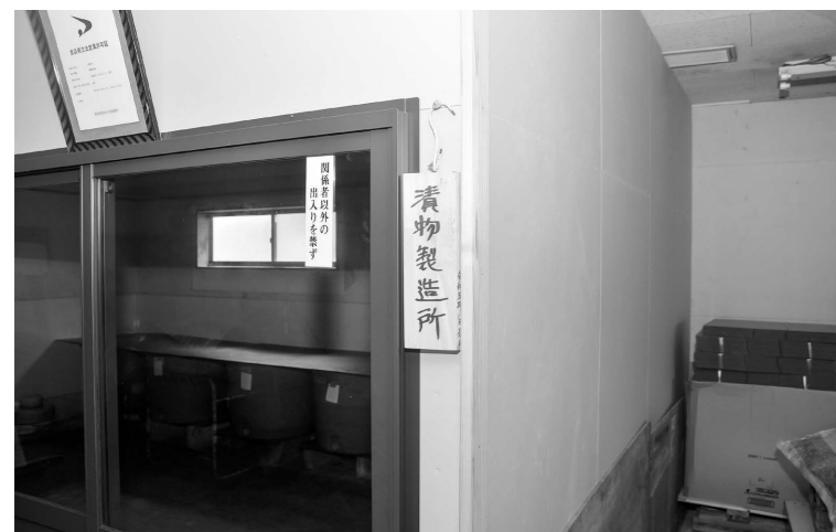
食品衛生法改正に伴う、漬物製造施設の設置や老朽化が進んだ外壁の塗装に活用。