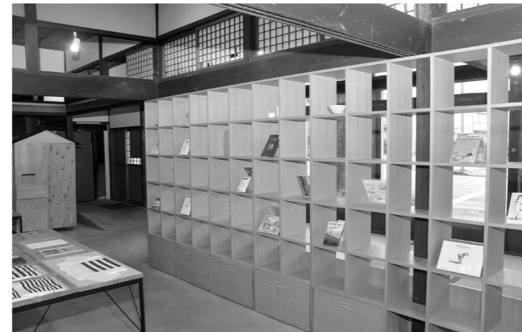
昨年制作した絵本やブローチといった商品を宣伝するためのイベント参加に係る費用に活用。