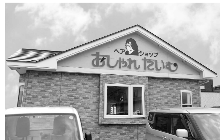
築30年が経過し、老朽化・劣化が進んだ設備の改修に活用。