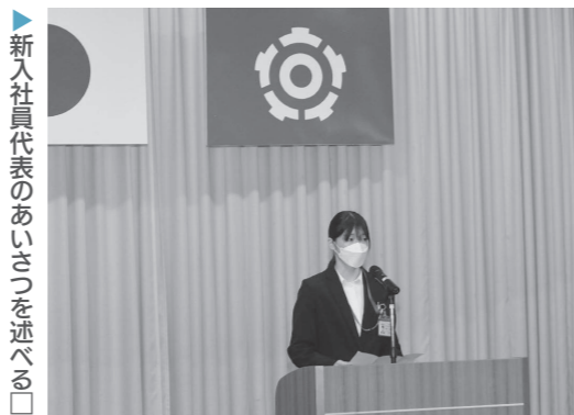
▶新入社員代表のあいさつを述べる□□さん