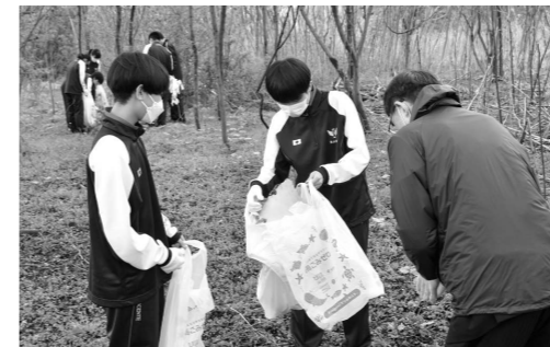
みんなで協力して、馬場目川クリーンアップ!

4名の皆さんは、集落の生活機能の維持や地域活動の活性化などを図るため、地域の状況調査(集落点検)や課題解決への具体策検討などに取り組みとともに、地域の魅力、行事に関する情報発信などを行ってまいります。