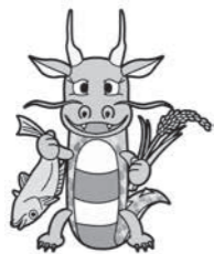
八郎湖水質保全シンボルキャラクター「清龍くん」

八郎湖の湖沼水質保全計画(第3期)では、八郎湖の望ましい水環境や流域の状況などに関する将来像として長期ビジョン「恵みや潤いのある“わがみずうみ”」を掲げ、令和8年度の達成を目指しています。