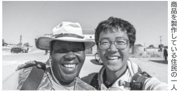
商品製作している住民の一人