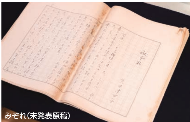
みぞれ(未発表原稿)