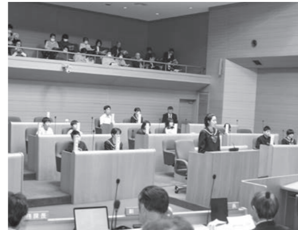
実際の議場で、多くの傍聴者が見守るなか、議員質問席に立って発言