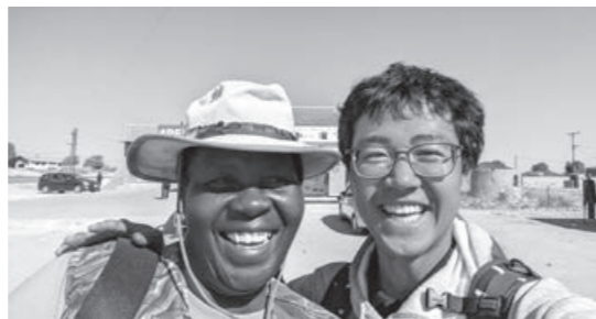
商品を製作している住民の一人