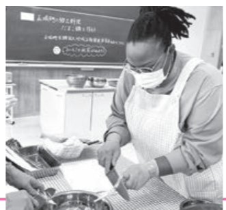
中学生とだまこ作り

みなさんお元気ですか。私は町や文化を知ることができて、とても楽しい時間を過ごしています。天翔太鼓の練習を始めたり、五城目ナイトマーケットに行ったり、小学校で書道パフォーマンスを観たり、中学1年生と一緒に「だまこ」の作り方を学びました。アメリカの友達に作ってあげられるように、また「だまこ」を作りたいです。 私は日本語を勉強中です。毎週勉強しています。町のみなさんとお話をして、もっと町のイベントに参加したいと思っています。これからも日本語で話しかけてください。勉強を続けていきます。 私と一緒に英語の練習をしたい方には、週1回、5週にわたり、町民センターで午後6時30分から午後7時30分に開催する英語教室があります。中学生以上の方を対象としていますので、ぜひご参加ください! 詳しくは13号「インフォメーション」をご覧ください。