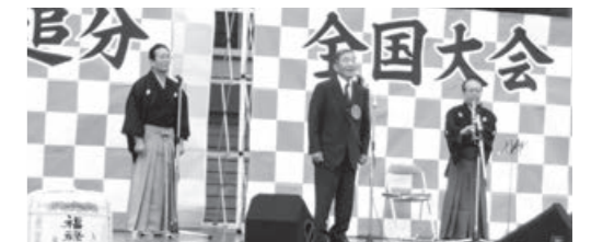
大会には3部門で46人が出場