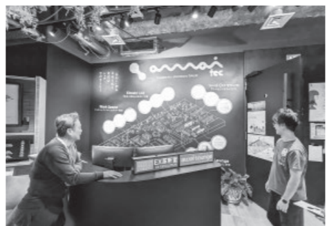
場の思いを共有する壁の黒板で説明を伺う

都会での学びを活かしつつ、五城目の良 さをさらに深めるお手伝いをしながら、 日々を重ねていけたらと思っています。こ の冬もみなさんと一緒に、五城目ならでは の時間を味わっていききたいですね!