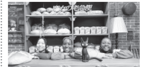
横手市のジブリ展での一枚

ハッピーバレンタインデー! バレンタインデー は、アメリカでは魅力的な祭日です。 学校では、生徒たちがお互いにお菓子やバレンタ インカードを交換したり、先生に配ったりしま す。カップルは一緒に過ごしてプレゼントを交換 し、独身の人は友達と過ごしたり、チョコレート を食べて一人の時間を楽しんだりします。 みなさんも、新年を楽しんでいることと思いま す。私は、潟上市のALT(外国語指導助手)2人 と一緒に横手市のジブリ展に行き、とても素敵な 写真を撮ることができました。そして、初めてスキ ーに行きました!! 怖かったですが、とても楽し かったです。今月は、秋田の冬の祭りに行くのを 楽しみにしています。私が本当に楽しみにしてい る祭りは2つあって、なまはげ柴灯まつりと横手 のかまくらです。良い写真を撮って、皆さんに シェアしたいと思います!