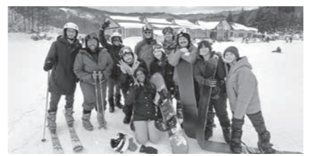
スキー場での一枚

卒業シーズンですね! アメリカでは、卒業式は通常5月~6月に行われます。この時期には、たくさんの人々が卒業生と愛や贈り物を共有します。学校生活は楽なものではありません。だからこそ祝福されるに値するのです。 中学校3年生の皆さん、卒業おめでとうございます! 学校で会えなくなるのは寂しいですが、一生懸命頑張ってきた皆さんを誇りに思います。皆さんが高校で素敵な時間を過ごし、たくさんの新しい思い出ができるよう願っています。 小学校から中学校へ進学する6年生の皆さん、おめでとうございます! 制服姿の皆さんを見るのをとても楽しみにしています。来年度、皆さんがどれだけ成長し、学んでいくのかを見るのが待ちきれません。 2月にスキーに行った時の写真も載せておきます!