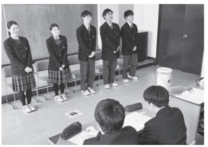
キャリアアップ集会では、企業などの採用面接を再現