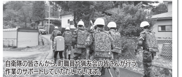
自衛隊の皆さんから、町職員や猟友会の皆さんが行う作業のサポートいただいています。