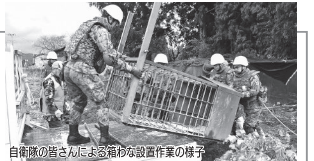
自衛隊の皆さんによる箱わな設置作業の様子

自衛隊の活動は、県と自衛隊との「クマ被害防止のための活動の支援に係る協力協定」に基づき、町からの要請を受けて実施されており、町では11月18日から活動を開始。大きな負担となっている、クマ捕獲用箱わなの設置や移動などを中心に、クマ被害を防止するための活動をサポートしていただいています。