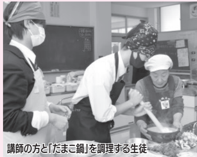
講師の方と「だまこ鍋」を調理する生徒