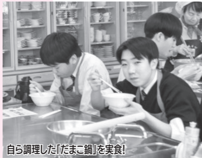
自ら調理した「だまこ鍋」を実食！