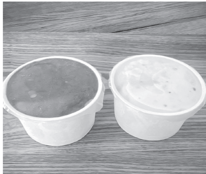
甘酸っぱさが癖になるラズベリージェラートを開発。