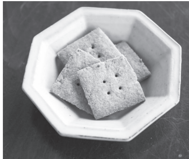
町内のお菓子屋「つむぐ」と共同開発した白ごまクッキー

白ごま油を製造する中で発生する副産物（搾りかすや澱）を活用した、お菓子やドリンクを開発しました。